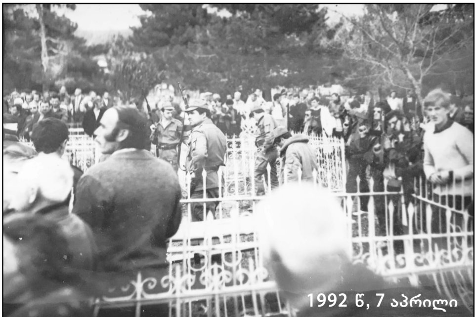
1992 წ, 7 აპრილი

ძალიან მიჭირდა აქ დარჩენა ჩემი ერთადერთი შვილის გარეშე. მიწოდდა გარემო შემეცვალა და ქუთაისში გადავედი საცხოვრებლად. 7 წლის განმავლობაში სამხედრო ნაწილში ვიმუშავე. მიწოდდა ჯარისკაცებთან ახლოს მემუშავა, მათი ყოველდღიური ყოფა ახლოდან მენახა. მზარეულად ვმუშაობდი და მათზე ვზრუნავდი. დედოფლისწყაროში ჩემი შვილის საფლავზე წელიწადში რამდენჯერმე თუ ვერა, აღდგომის დღესასწაულზე აუცილებლად ჩამოვდივარ-ხოლმე. საფლავს ვასუფთავებ, ვუვლი, ვღებავ... ბევრს ვფიქრობ, რომ ქუთაისში სახლი გავყიდო და საცხოვრებლად ისევ დედოფლისწყაროში დავბრუნდე, ჩემი შვილის საფლავთან ახლოს ვიქნები.