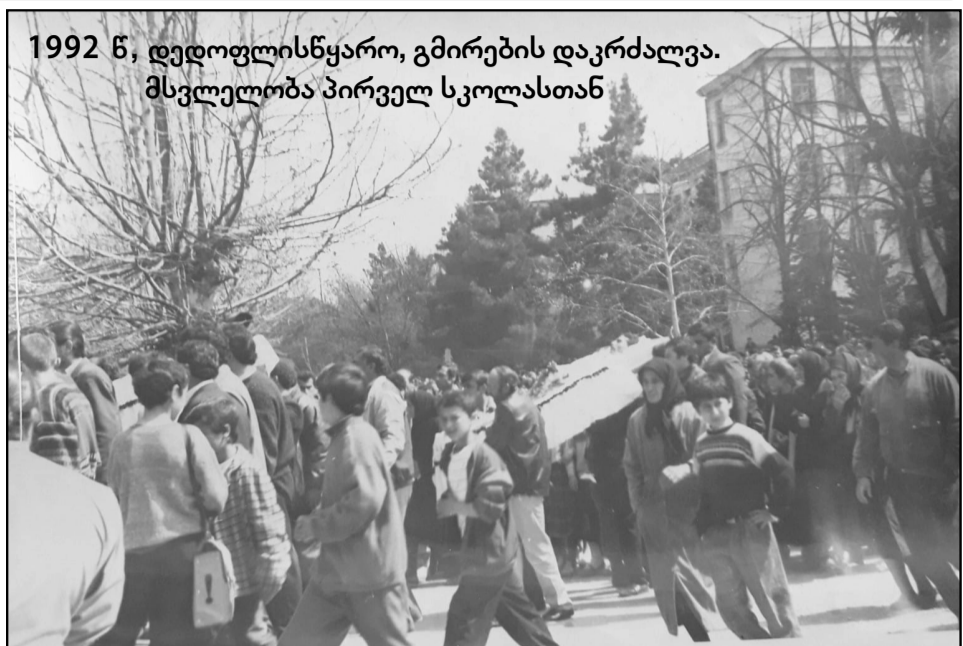
1992 წ, დედოფლისწყარო, გმირების დაკრძალვა. მსვლელობა პირველ სკოლასთან