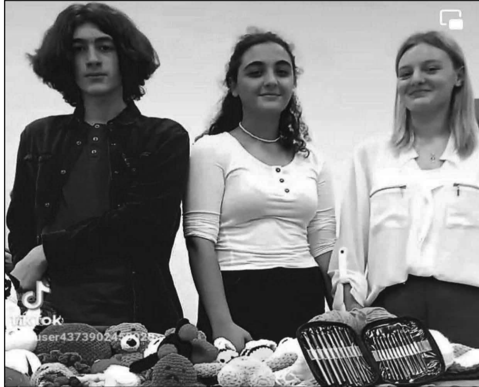
ჩამოვიდნენ ფესტივალიდან, რომ იმე-

ვიდან გვეგონა, რომ ქსოვისთვის საჭირო ინვენტარი თუ მასალები ჩვენ უნდა შეგვეძინა და ფინანსებიც ჩვენი უნდა ყოფილიყო, გარკვეული თანხის მობილიზებაც შევძელით, მაგრამ აღმოჩნდა, რომ ახალგაზრდული ინოვაციების ცენტრი უზრუნველგვყოფდა ყველა საჭირო რესურსით. 200 ლარით დაგვაფინანსეს და ყველაფერში გვერდით დაგვიდგნენ, თუკი რამე გვჭირდებოდა. იქნებოდა ეს ტრანსპორტირების, დაბინავების თუ სხვა საკითხები. დემო დღეზე ყველა ძალიან ვენერჯიულობდით, იმიტომ, რომ ასაკით პატარები ვართ, მსგავსი გამოცდილება არასდროს გვქონია, არ ვიცოდით რას ვაკეთებდით, ცოტა დროც გვქონდა მოსამზადებლად, ყველაფერი დამოუკიდებლად უნდა გავგვეკეთებინა. მაგრამ, როცა პირველი ნაქსოვი სათამაშო გაიყიდა, მაშინ მივხვდით, რომ ჩვენი შრომა ნამდვილად დაფასდა. მთელი ზაფხული ვიშრომეთ, ერთ გუნდად შევიკარით და ეს ნამდვილად ამაღელვებელი მომენტი იყო ჩვენთვის. ძალიან გვინდა, რომ განვაგრძოთ და განვავითაროთ ეს საქმე. ამით არ დასრულვებულა ცენტრთან ჩვენი ურთიერთობა, მომავალშიც ვაპირებთ მათ პროექტებში მონაწილეობას, მაგრამ ერთი პრობლემა გვაქვს: გუნდში გადანაწილებული გვაქვს ჩვენი საქმე, ზოგს