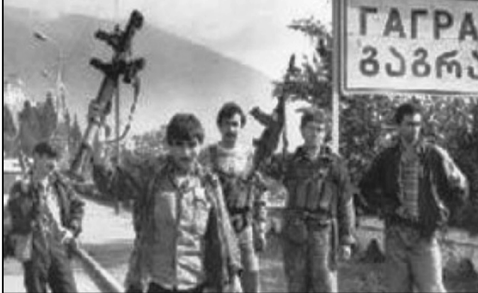
ნითელი ჯვრის კომიტეტის ცნობით, 2013 წლის შემდგომ სულ ნაპოვნია 563 ადამიანის ნეშტი, აქედან 191 ამოცნობილია და გადაეცა ოჯახებს. გრძელდება მუშაობა კონფლიქტების შედეგად გაუჩინარებული ადამიანების სევედრისა და ადგილსამყოფელის დასადგენად. 1992-93 წლების აფხაზეთის კონფლიქტის შედეგად გაუჩინარებულ ადამიანებთან დაკავშირებულ საკითხებზე მომუშავე საკოორდინაციო მექანიზმის ფარგლებში, კომიტეტი 2010 წლიდან ფუნქციონირებს და მასში აფხაზი და ქართველი მონაწილეები არიან ჩართული. პლატფორმა მხოლოდ ჰუმანიტარულ ხასიათს ატარებს და უგზო-უკვლოდ დაკარგულთა ოჯახების სახელით მოქმედებს.