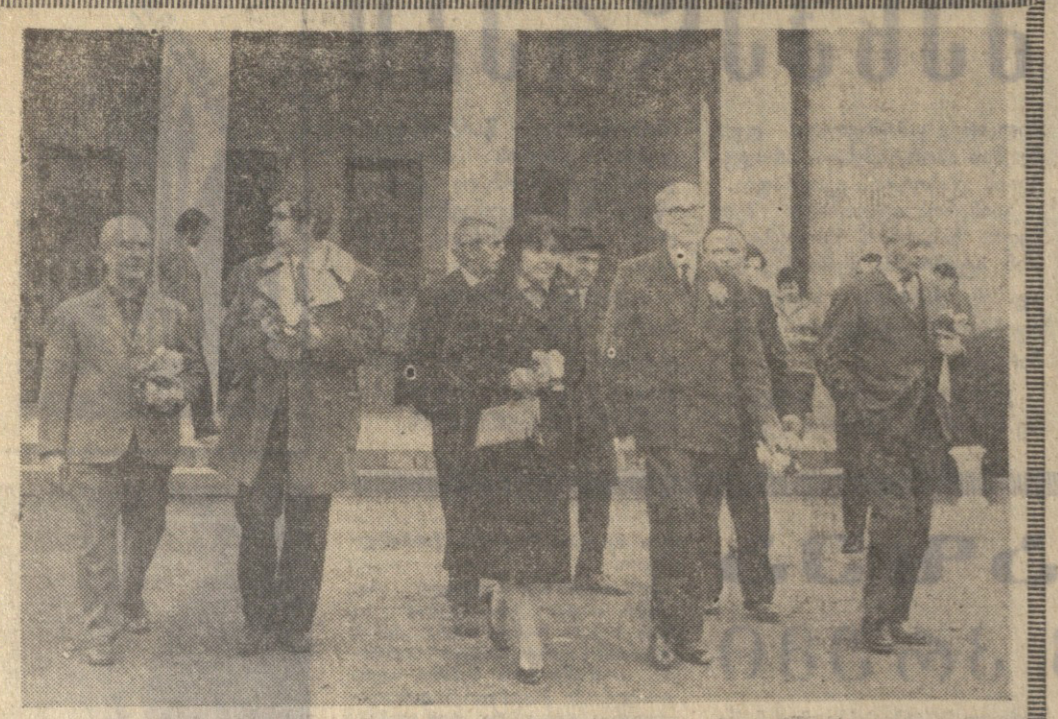
იტალიის წინააღმდეგობის მოძრაობის მონაწილენი საქართველოში

სოფელი და მუშაკი სოფლის მეურნეობის მდივანის მოადგილე, ხუთწლიანი მუშაობის შემდეგ, მეთექვსმეტი წლისაა.