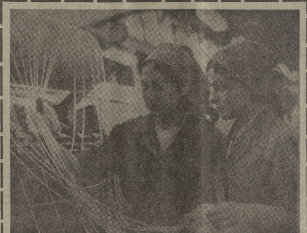
ქუთაისის ლინის სახელობის მუხრანის მხარეში მდებარე ქუთაისის ლინის სახელობის მუხრანის მხარეში...