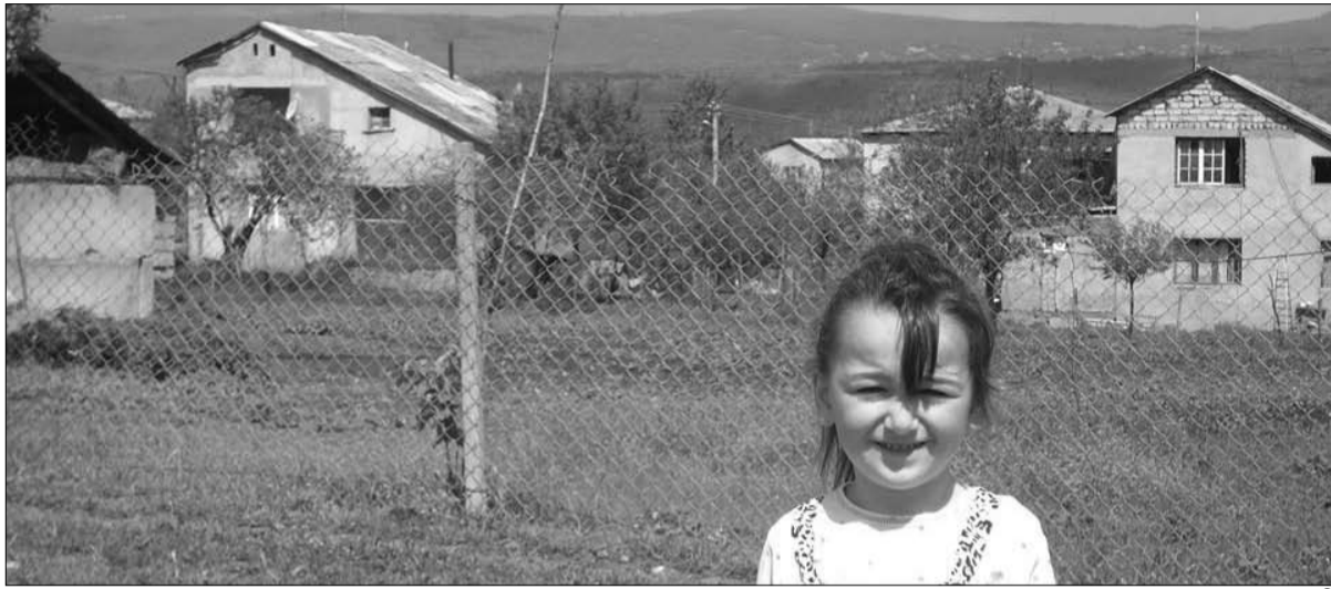
„საფოტო“ (ლიპა ჩახუნავილი) ©

ძნელია, დღეს ცხოვრობდე მაღალმთიან სოფელში, გადაიღო ფეხი ფეხზე და ითვლო ვარსკვლავები ან ბუზები, როგორც ერთ ჩვენს თავდას სჩვეოდა ერთ დროს. თუმცა, სხვა რა გზაა, როცა სახელმწიფო იმის საშუალებას არ გაძლევს, რომ მიწა დაამუშავო, სარჩო მოიყვანო და ოჯახი გამოკვებო.