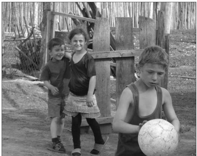
„საფოტო“ (ლიპა ჩახუნავილი) ©

გასაკვირი იყო ის ფაქტი, რომ იქ მედიატორით ჩასულმა ჟურნალისტებმა (ბილაინის აბონენტებმა) სმს-ის სახით ასეთი შეტყობინება მიიღეს „კეთილი იყოს თქვენი მობრძანება აზერბაიჯანის ტერიტორიაზე“. სოფელს, რომელსაც ერთ დროს ერისიმიდი უწოდეს, გზა დაზიანებული აქვს. აქ არც სასწრაფო დახმარების მანქანა ადის და არც პენსიის მიმტანი ჰყავს მოხუცებს. პენსიას ისინი წინორაში იღებენ და, შესაბამისად, გზის ფულად 15 ლარს იხდიან.