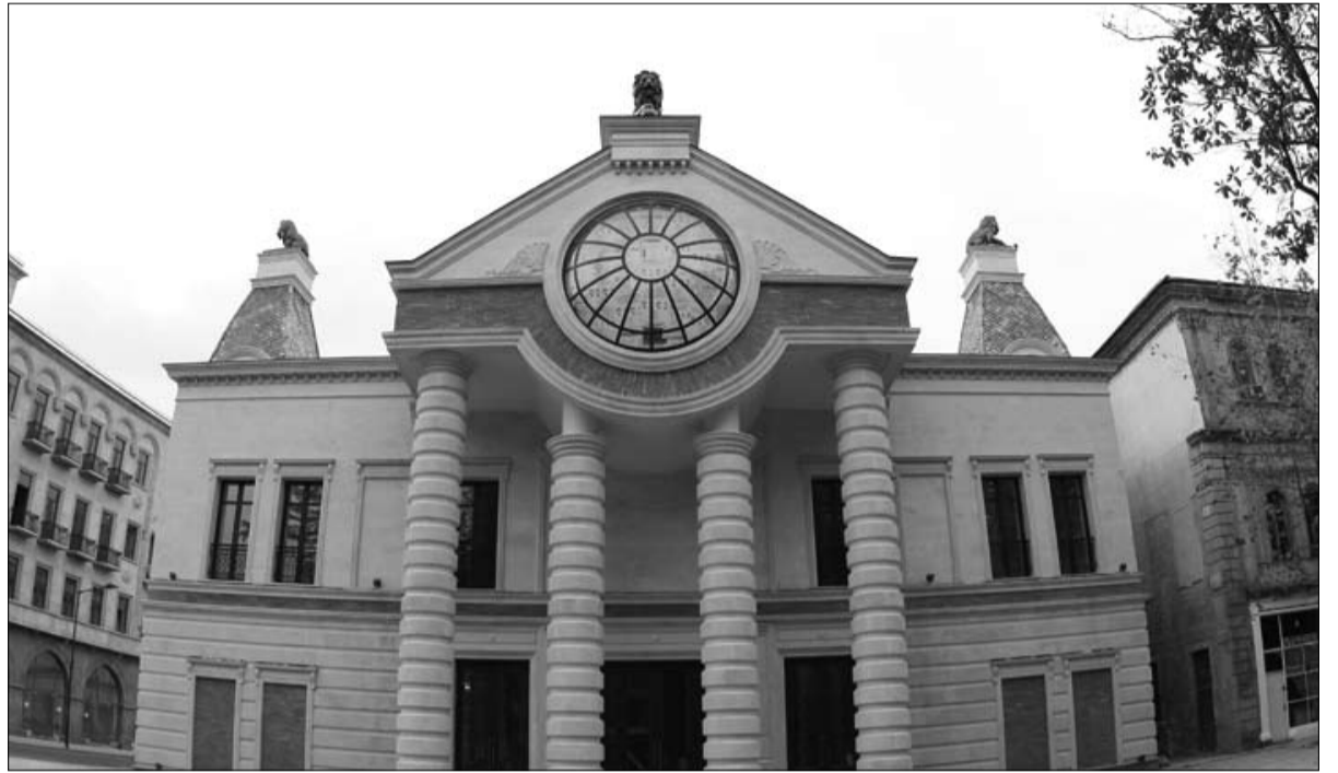
ქუთაისის ბალანჩივაძის სახელობის ოპერის თეატრი