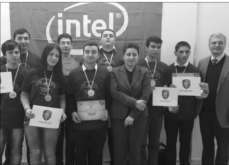
ანდრია რაზმაძის სახელობის ქუთაისის №41 ფიზიკა-მათემატიკის საჯარო სკოლის მოსწავლეები კონკურსის „ინტელის“ ნარკომადგენლობის პრემიის მფლობელები

სწორედ ამ კლუბის წარმატებების გამო ქუთაისის მერამ სასწავლო ოლიმპიადებში გამარჯვებულია შორის დასაჯილდოებელთა სიაში პირველად შეიყვანა გამომგონებლები და ფულადი ჯილდოები გადასცა მათ. ეს ჯილდოები არ იქნებოდა, რომ არა, ბატონების,