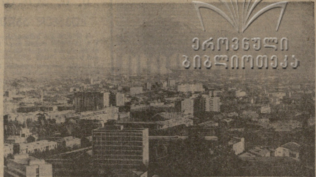
ქალაქი ვერეჯიანი სომხეთის ფოტოგრაფია.