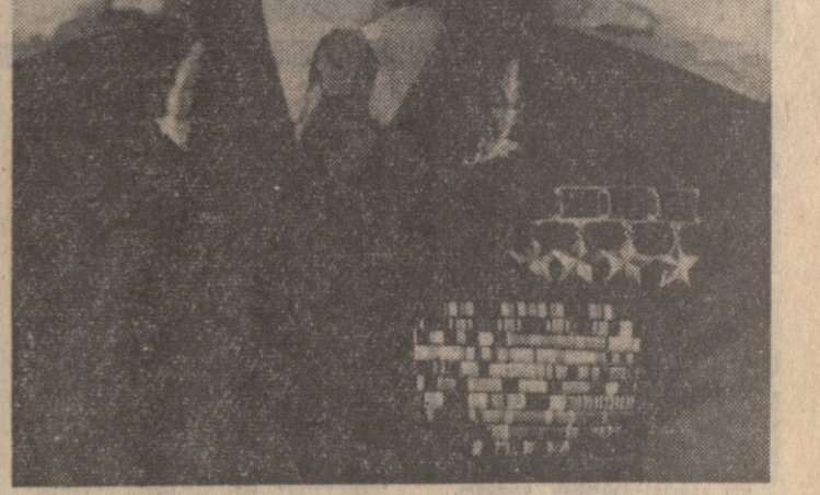
პარტიის მუშაობის შესახებ...