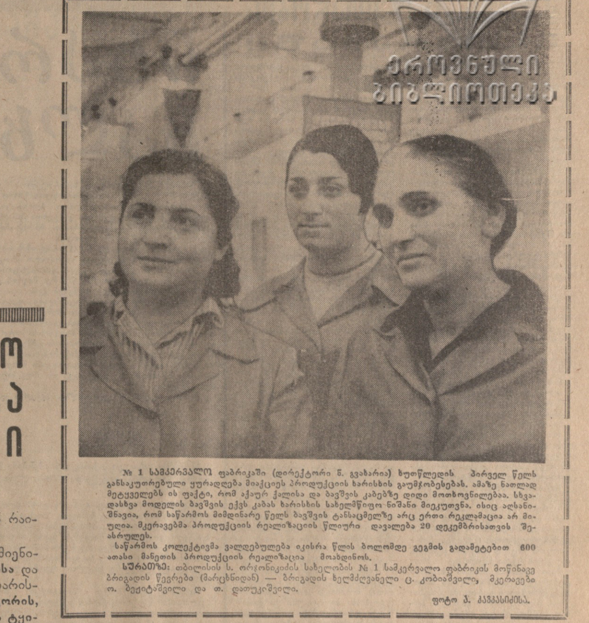
№ 1 სამხრეთ-დასავლეთი (დირექტორი ნ. ვახარია) ხელმძღვანელი პირველი წლის განსაკუთრებული უნარდამაჩვენებელი მოსწავლეების ხარისხის გაუმჯობესების...