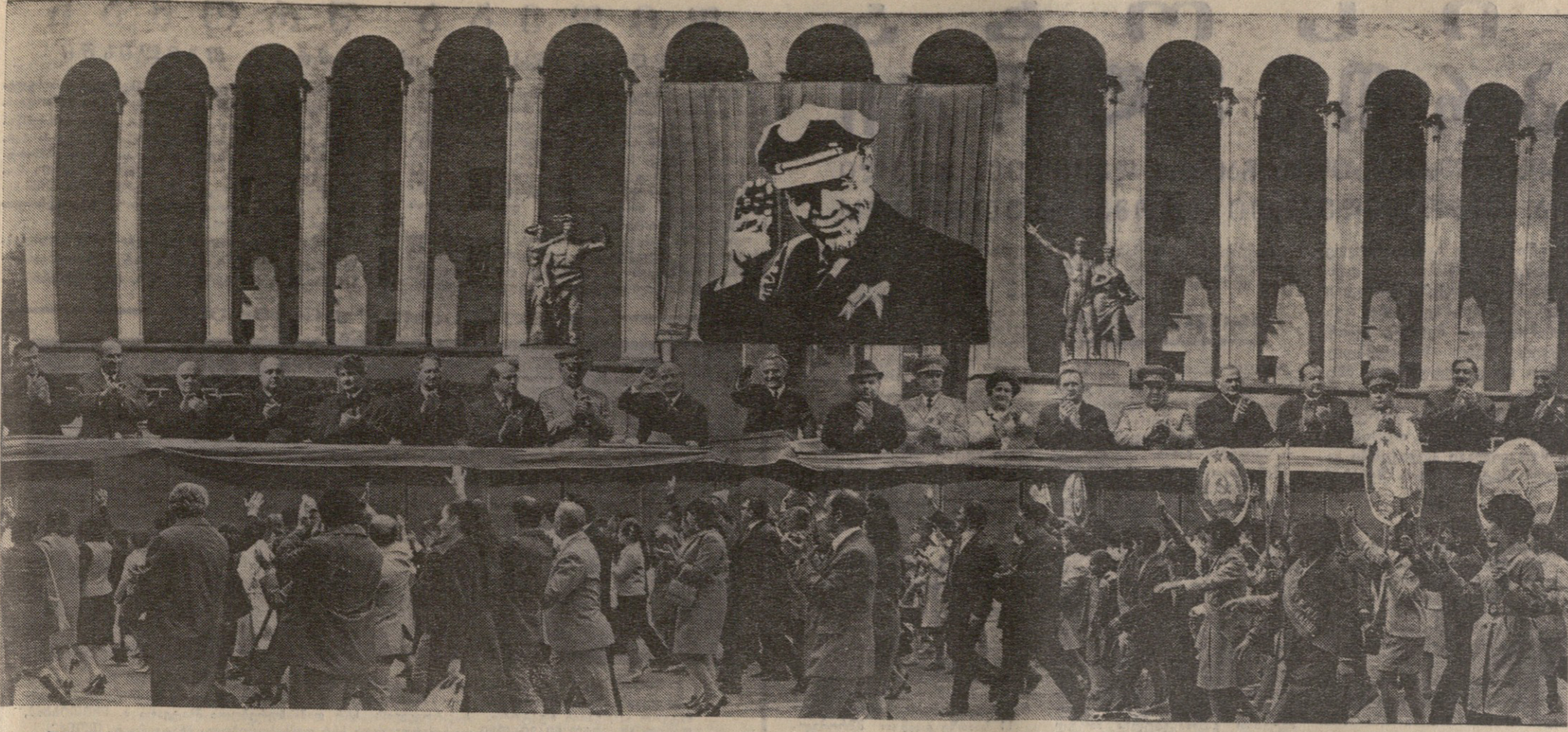
თბილისი. 1973 წლის 1 იანვარი. მხროველითა დემონსტრაცია რუსთაველის პარკში.