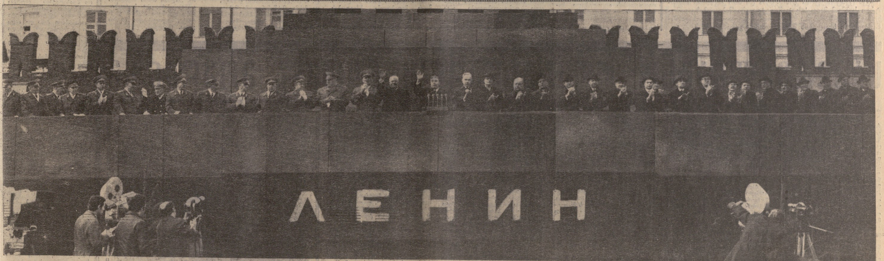
საპირველმაისო დღესასწაული მოსკოვში. მობრუნდა დამოწმებადი წითელი მოედანი, სადა რატომაც ი. ი. ლენინის მავროლავის ბრძანაზე. საპირველმაისო საქართველოს ფორტულეგრაფი.

გაზეთი გამოდის 1920 წლის 3 ივნისიდან № 104 (15621)