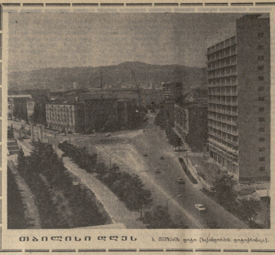
თბილისი ქუჩა