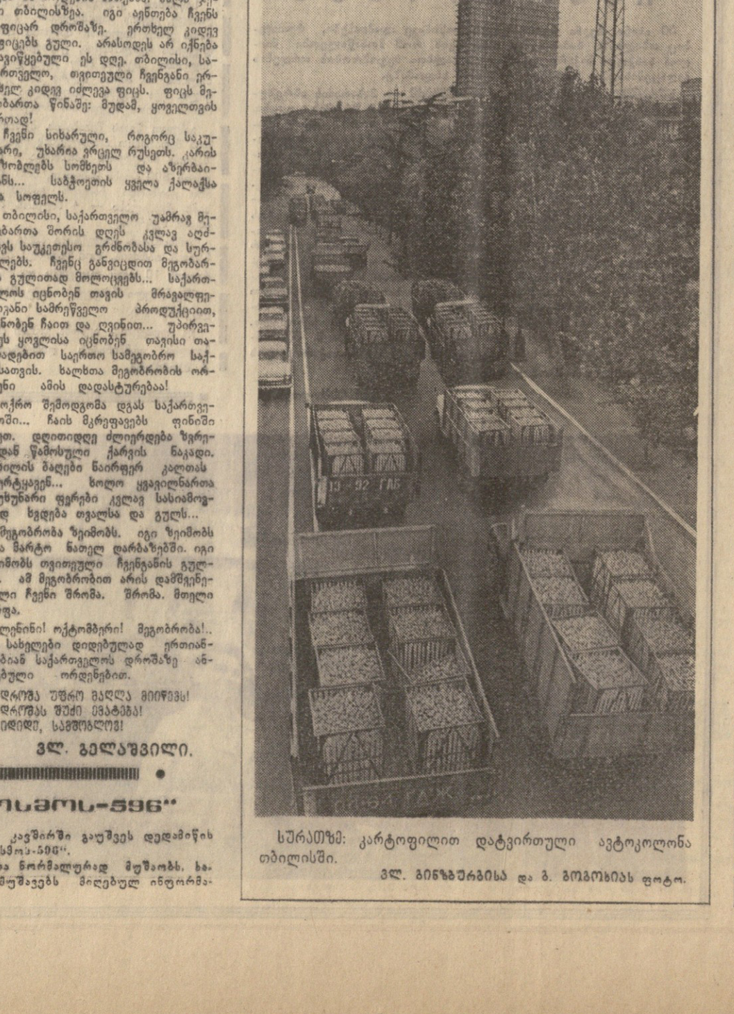
სურათში: კარტოფილი და ტანკოვანი აბტოლონი