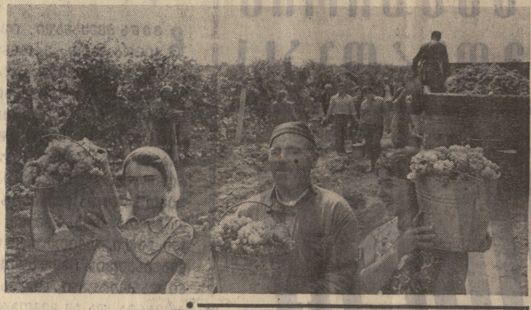
300.000 ტონა შარბინათვის