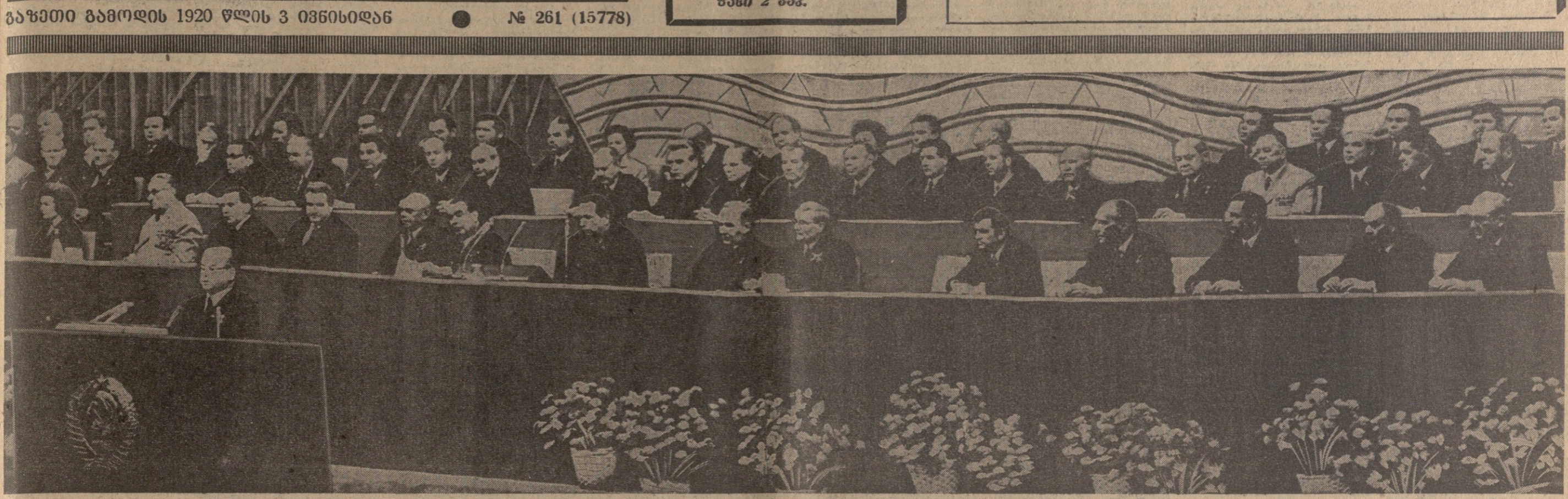
მოსკოვი, 6 ნოემბერი, კრემლის ურთილბათა სახალბე. სურამია დიდი ოქტომბრის სოციალისტური რევოლუციის 56 წლისთაჲსადმი მიძღვნილ ხაზეიმო ხსლობის პრეზიდიუმო.