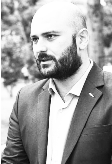
წესა. ეს რაზე მიახლოებებს?