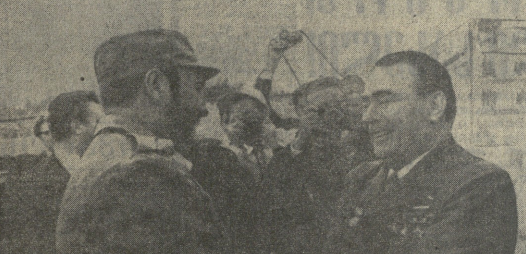
სსრ ცენტრალური კომიტეტის წევრები და კუბის კომუნისტური პარტიის კომიტეტის წევრები