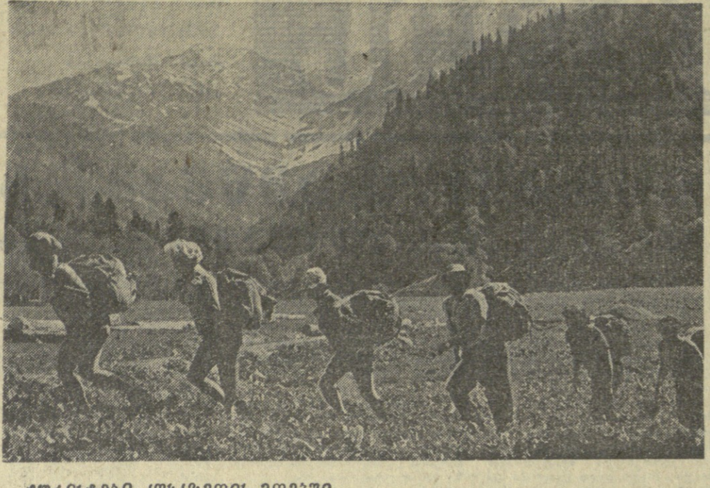
ტურისტები ჟეორგის მთებში...