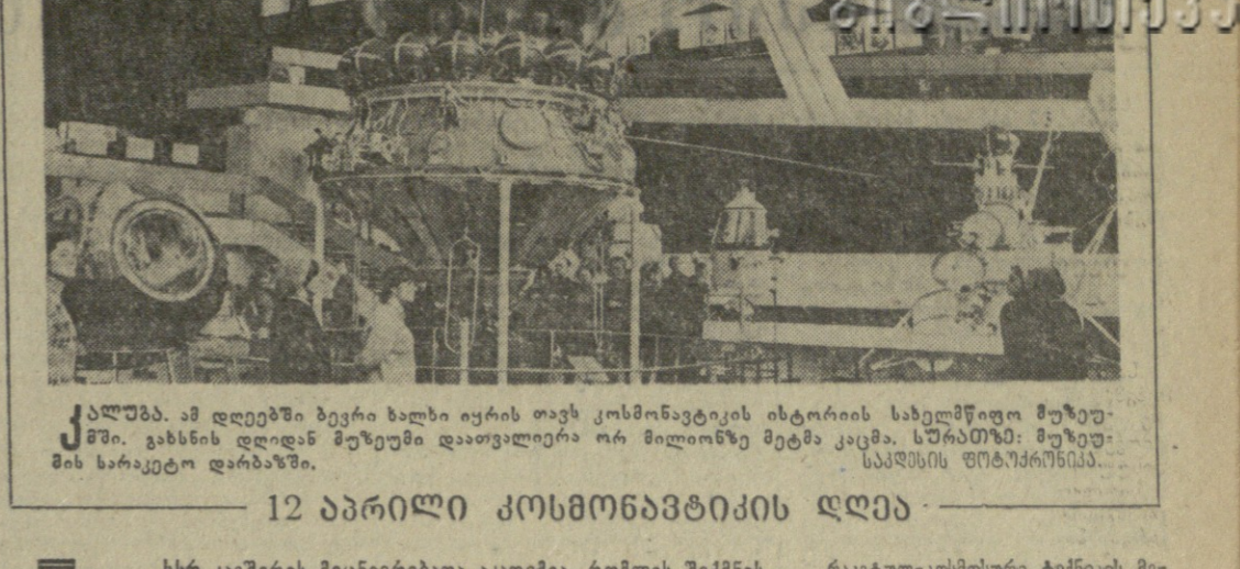
12 აპრილი კომუნისტების დღი