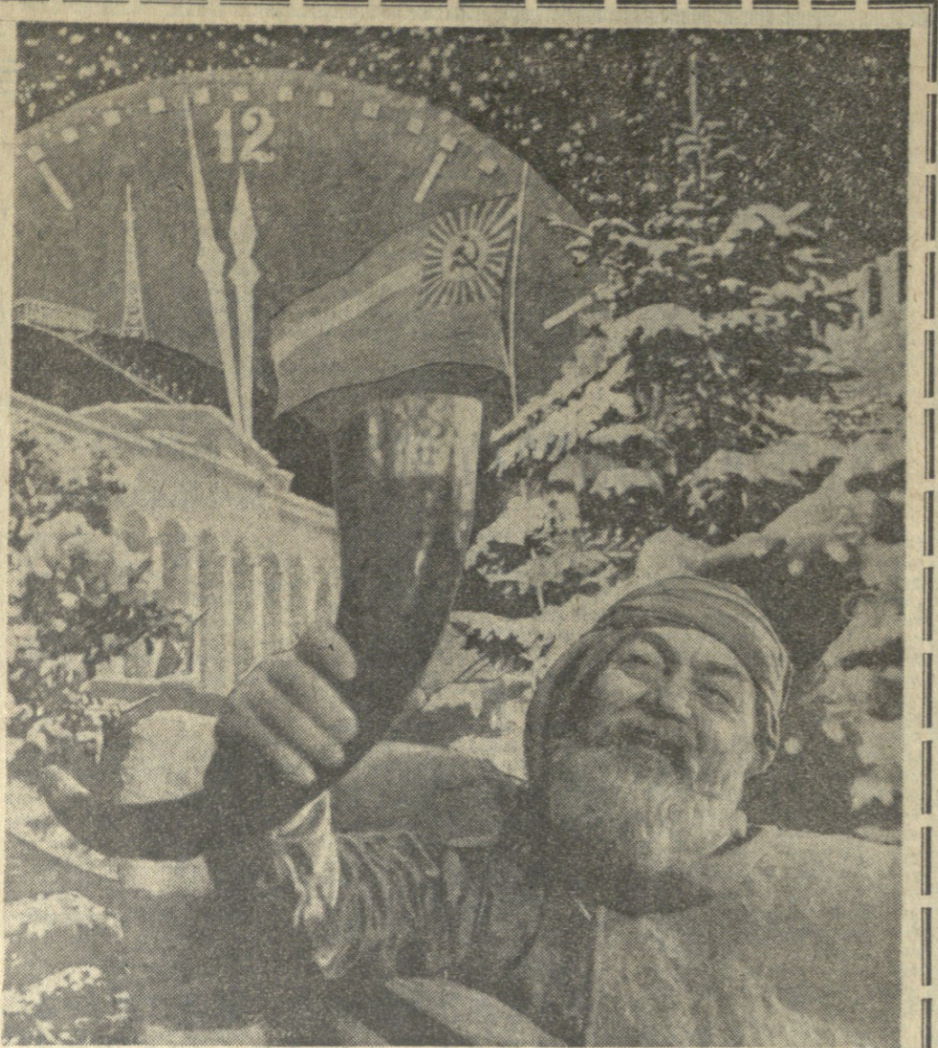
ჩვენნი ზაღინი სახალადა დანთიქ...