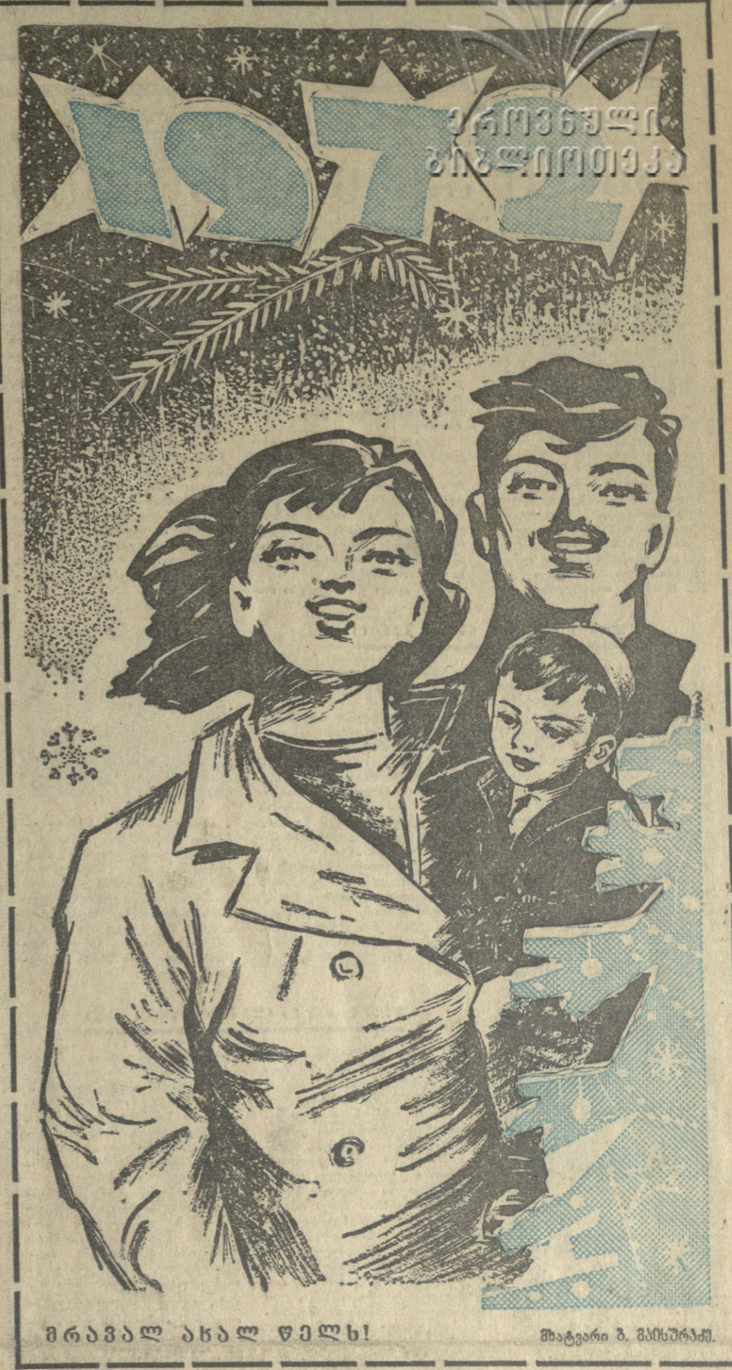
მრავალ ასალ ველს! მხატვარი ზ. მანუჩარიძე