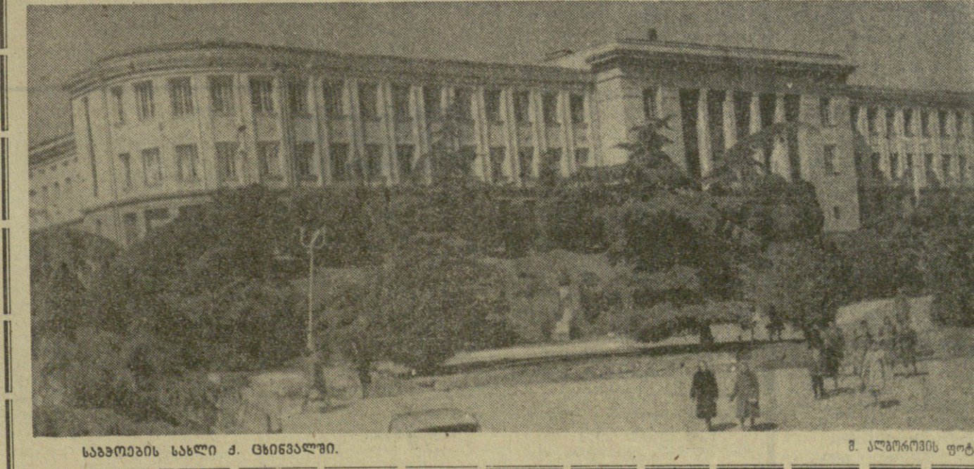
საბჭოთა ოსეთის ავტონომიური ოლქი