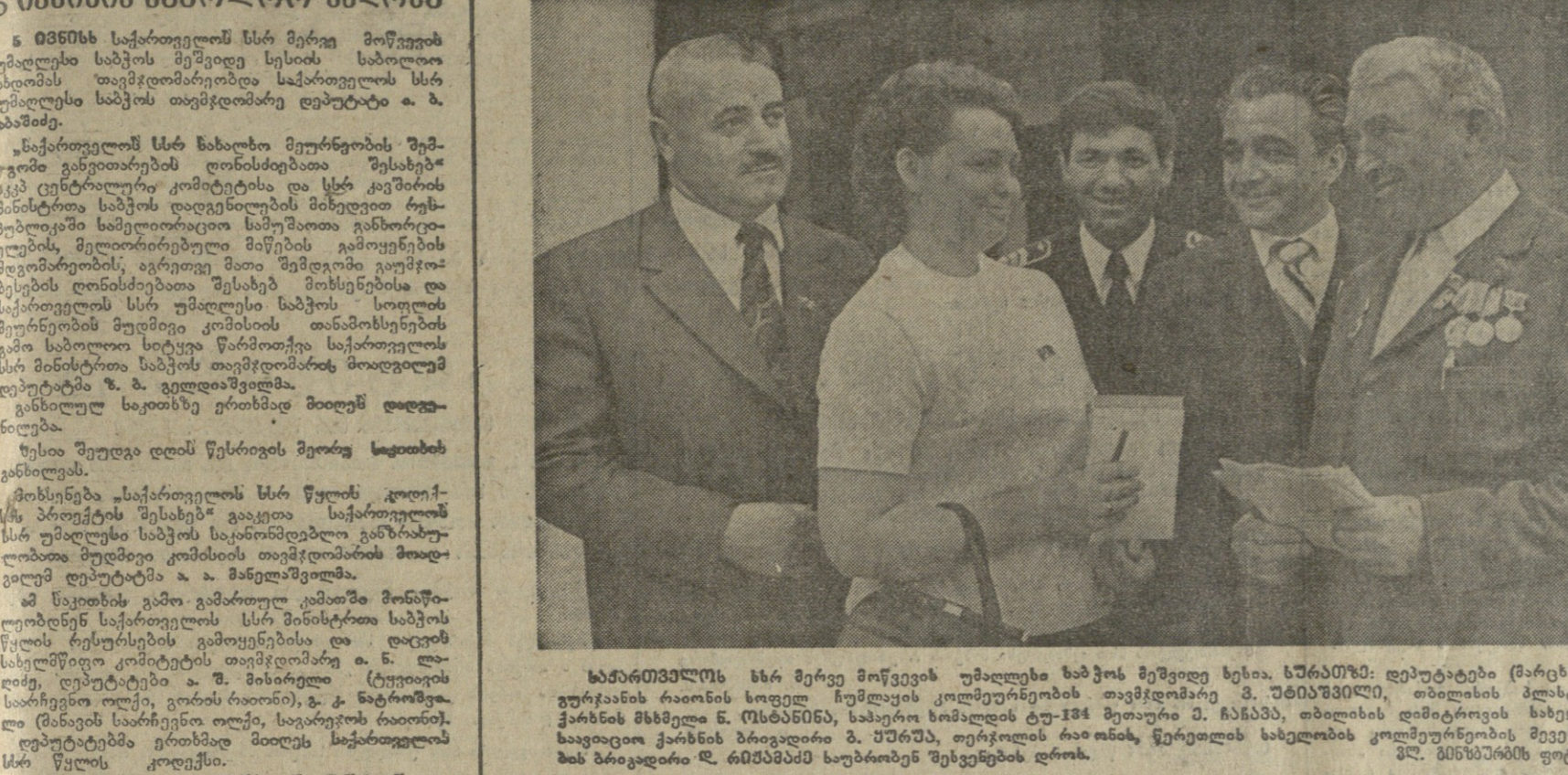
საქართველოს სსრ მინისტროს ვიცე-პრეზიდენტი...