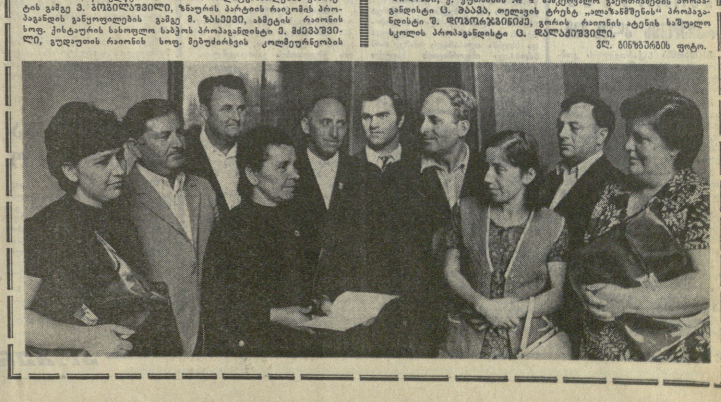
საქართველოს პროკავანდისტთა IV რესპუბლიკური შეკრების

საქართველოს კომპარტიის ცენტრალური კომიტეტის მიერ დადგინდა „სოიუზ-14“-ის კოსმოსური ხომალდით „სოიუზ-14“ კოსმოსში გაიშვება. მისი მისიონერული დაზოგვის მიზანია კოსმოსური ხომალდით „სოიუზ-14“ კოსმოსში გაიშვება.