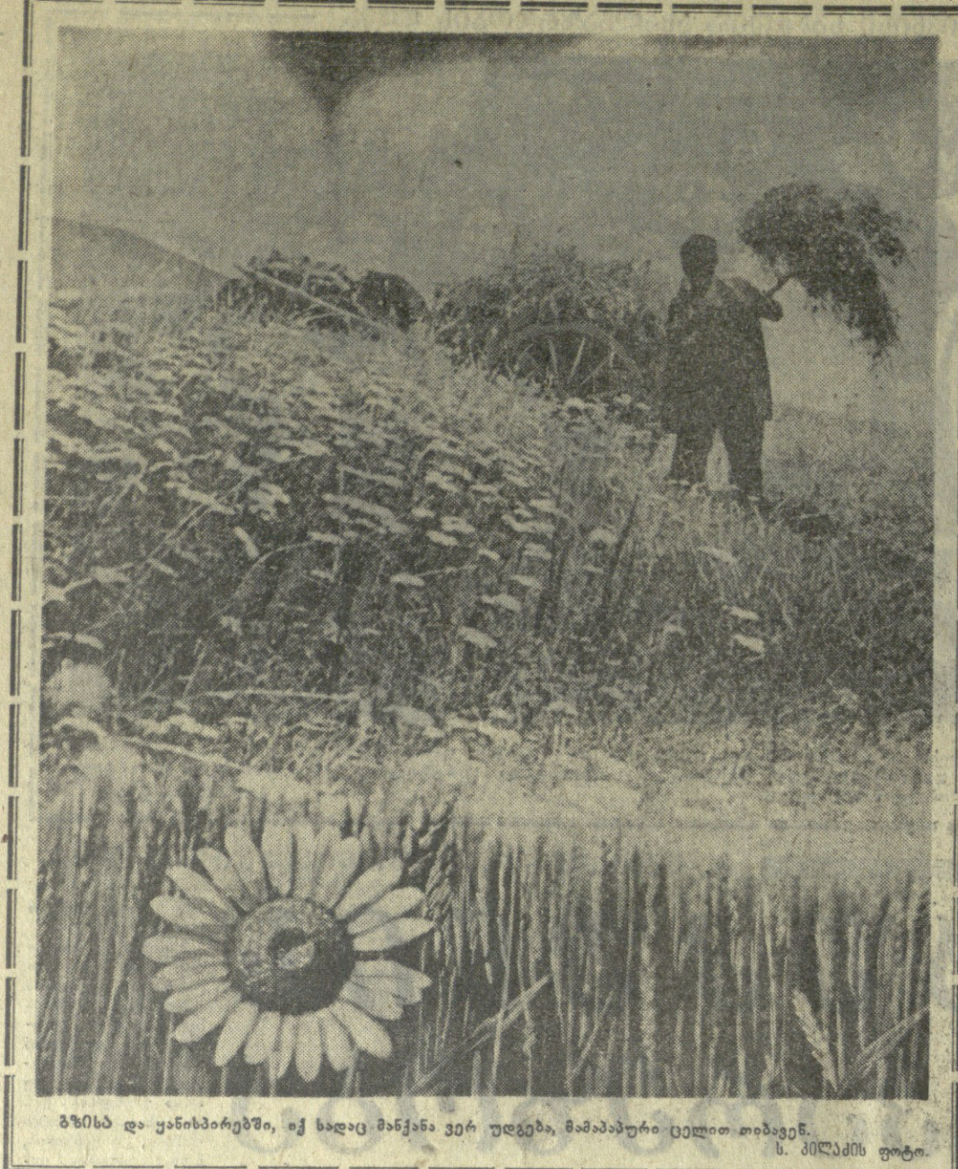
გზის და ყანის ბაზრებში, იქ ხალხი მანქანა ვერ უდგება, მამაკაცი უკლებლივ თოვალს...