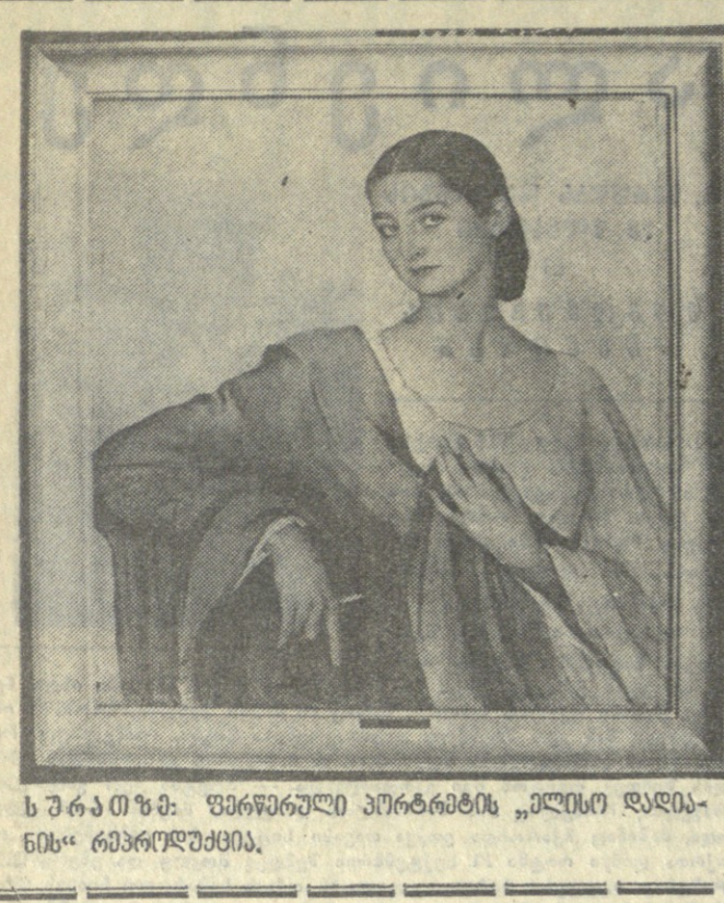
სურათი: ფერწერული პორტრეტის ავტორი დაინსხ "გაბრიელისთვის".