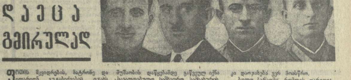
კომისია საქსის შესახებ