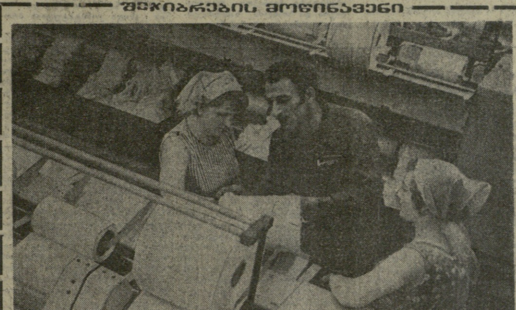
საზარმოსა და კლანტასიეზში