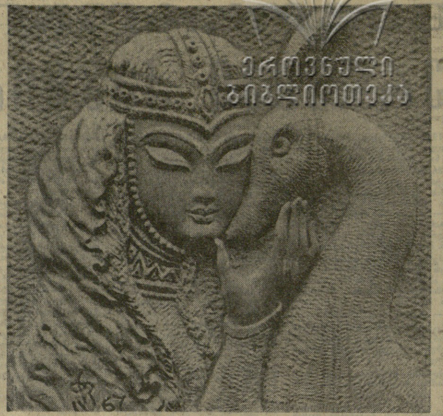
ხეზე კეთილი უკვე აღიარებული... რატომღაც არაა მათთვის... არაა მათთვის...