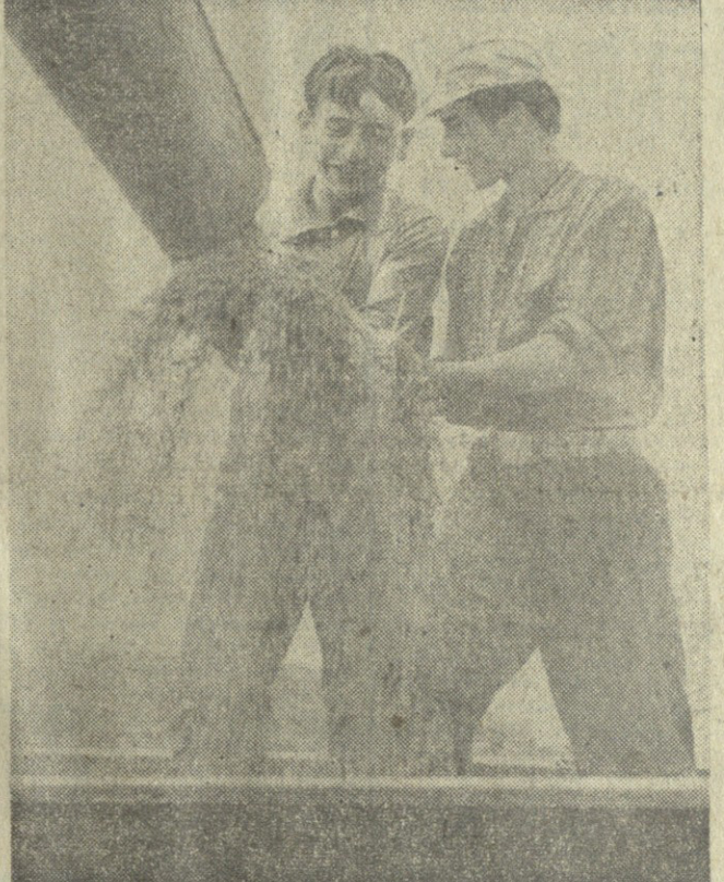
საბჭოთა ოსების ავტორმა რაიონული პარტიული კომიტეტის მდიანის პლენუმზე...