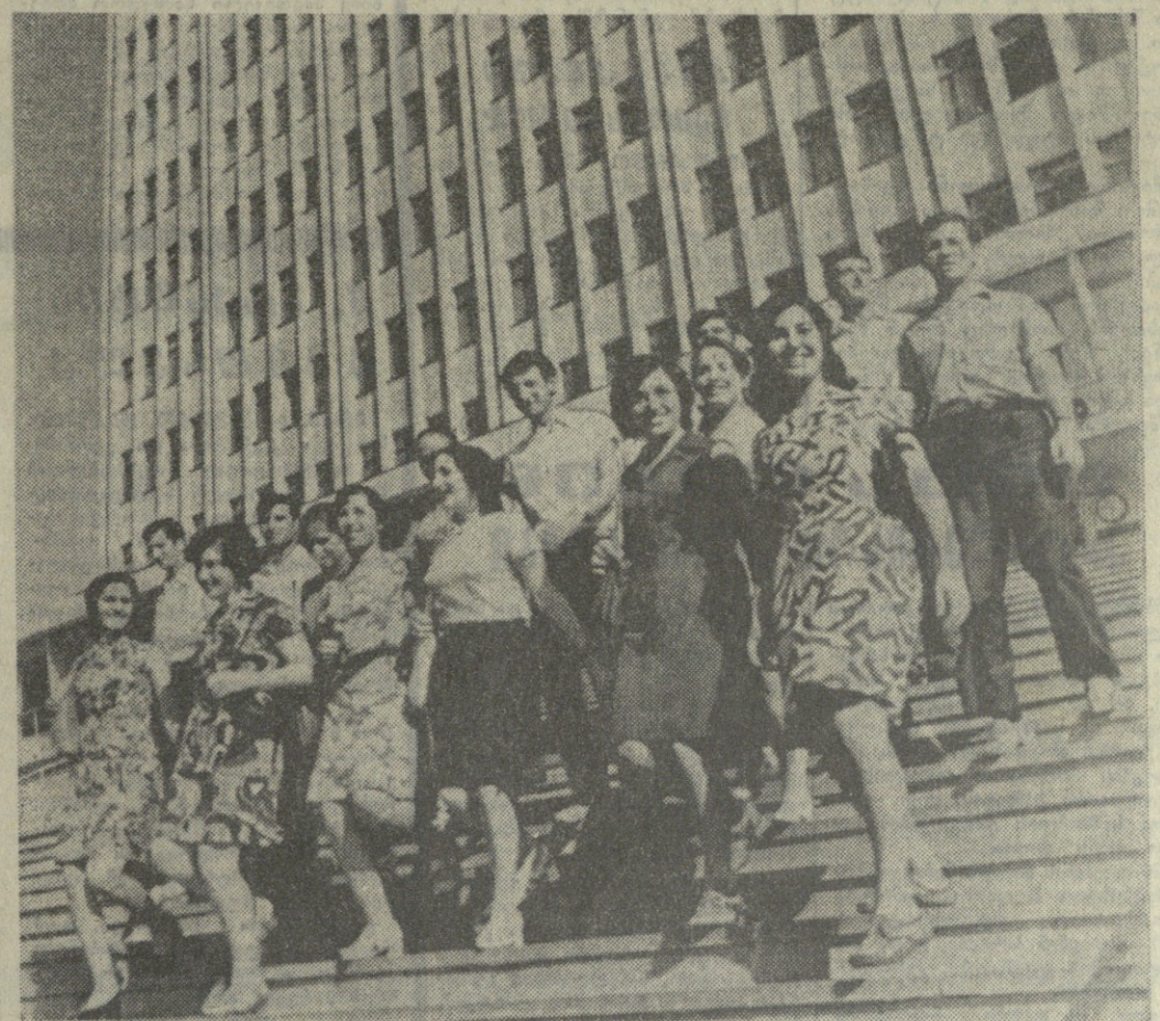
დღეს თბილისის შრომის წითელი ფრთის ორდენის სახელმწიფო უნივერსიტეტს ატარებენ სტუდენტები მიაშვილი, ზოგი სწავლას განაგრძობს, ზოგიც ახლა შეუდგება გზის მცენებარეობის მუშაობას. სურათი: თბილისის სახელმწიფო უნივერსიტეტის ფარგლებში მომზადებული სტუდენტების პირველი კურსის სტუდენტები ერთი ჯგუფი.