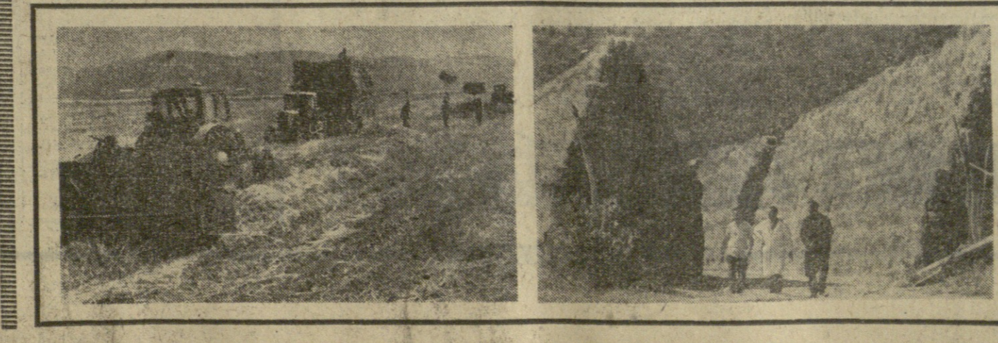
სოფლისმშენებელი მურენებში მუშაობის დროს