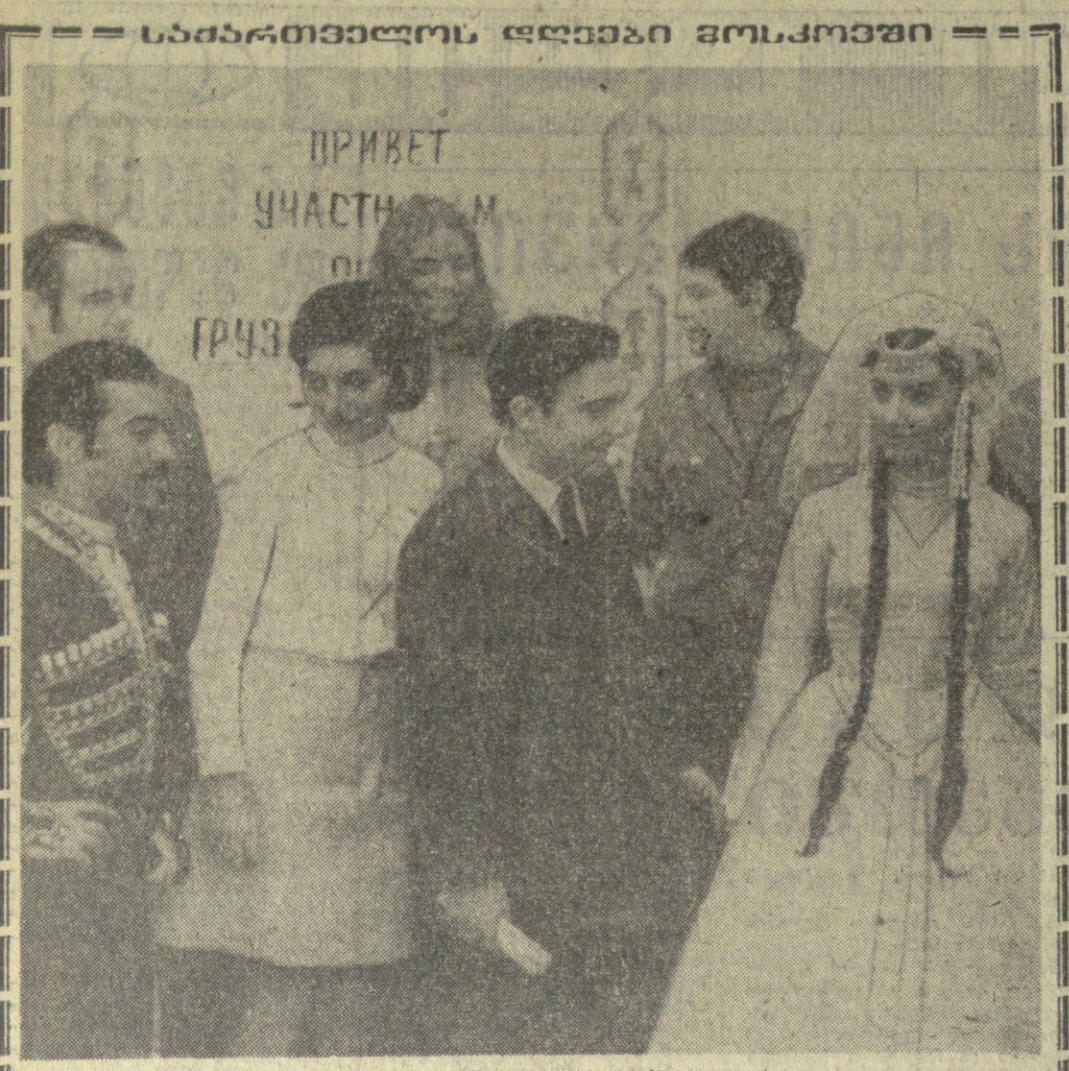
საბარტოვალის დედაები მოსკოვში პРИВЕТ УЧАСТИ М ГРУЗ