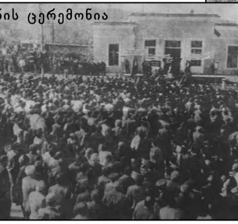
1990 წ. გახსნის ცერემონია

ტერიტორიაზე მისი განახლებაც. ძველი ქვები უკვე აყარეს და მალე გამოცვლიან. მრავალი წელია აქ ასეთი საფუძვლიანი რეაბილიტაცია არ ყოფილა. მაგრამ საქმე იმაშია, რომ ეს პროექტი მხოლოდ გარე სამუშაოებს აფინანსებს. გარედან რომ შეხედავ, მართლაც ლამაზია, მაგრამ ავტოსადგური ხომ ისეთი ობიექტია, სადაც სტუმარი და ტურისტები ყოველდღიურად მოძრაობს. როგორც კი შიგნით შევალთ, შიდა სივრცე ისევ ძველია. კედლები, იატაკი, შიდა ჭერი საშინელ მდგომარეობაშია. შიდა სამუშაოებს ეს კომპანია ვერ შეასრულებს, მეპატრონემ უნდა გაარემონტოს. ჩვენ ეს შენობა იჯარით გვაქვს აღებული, ყოველთვიურად 150 ლარს ვიხდით. ან ადგილობრივი ბიუჯეტიდან უნდა გამოინახოს თანხები ამ სივრცის გასაღებად, ან ჩვენ თავად უნდა