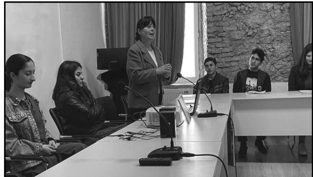
„ერი, რომელიც იგივეებს წარსულს, მას ვერ ექნება მომავალი“

„დიდი მადლობა წმინდა მეფე ვახტანგ გორგასლის