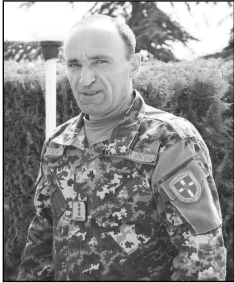
დაზუსტებულია სასაზღვრო ზოლი?

შსს სასაზღვრო პოლიციის დედოფლისწყაროს სამმართველოს ხელმძღვანელებმა ადგილობრივ ახალგაზრდებთან შეხვედრა გამართეს. სამმართველოს ხელმძღვანელმა პოლკოვნიკმა ნიკოლოზ ზურაბიშვილმა მოზარდების შეკითხვებს უპასუხა და საზღვრის მნიშვნელობასა და მესაზღვრის როლზე ისაუბრა. კითხვების დასმის შესაძლებლობა „შირაქსაც“ მიეცა. ეს უპრეცედენტო შეხვედრა იყო, რადგან ამ უწყებას ასეთი ფორმატის ღია შეხვედრა არასოდეს გაუმართავს და მათი ყოველდღიური საქმიანობის გაცნობა ხელმისაწვდომი აღარ არის. შეხვედრას, რომელიც ინტერაქტიულ რეჟიმში წარიმართა სამმართველოს უფროსის მოადგილე მერაბ შუბითიძეც ესწრებოდა.