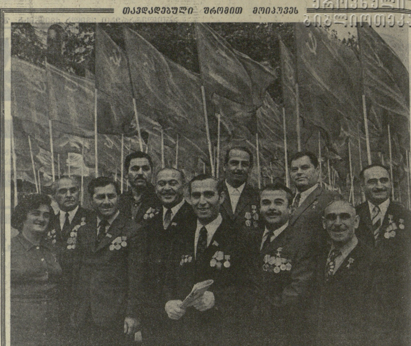
საქართველოს სახალხო რევოლუციური მთავრობის აკრებულნი... სახალხო რევოლუციური მთავრობის აკრებულნი...