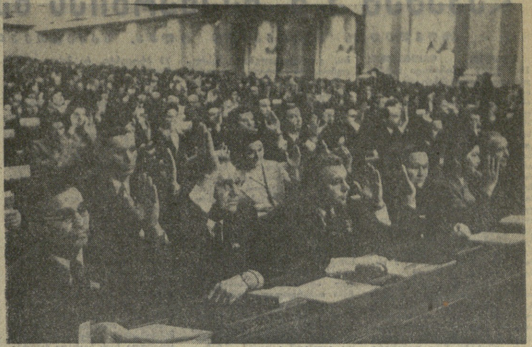
მოსკოვი, 20 დეკემბერი. კრემლის დიდ სახალხო გაიმართა კავშირის საბჭოს და ეროვნული საბჭოს მეორე, გაერთიანებული სხდომა.