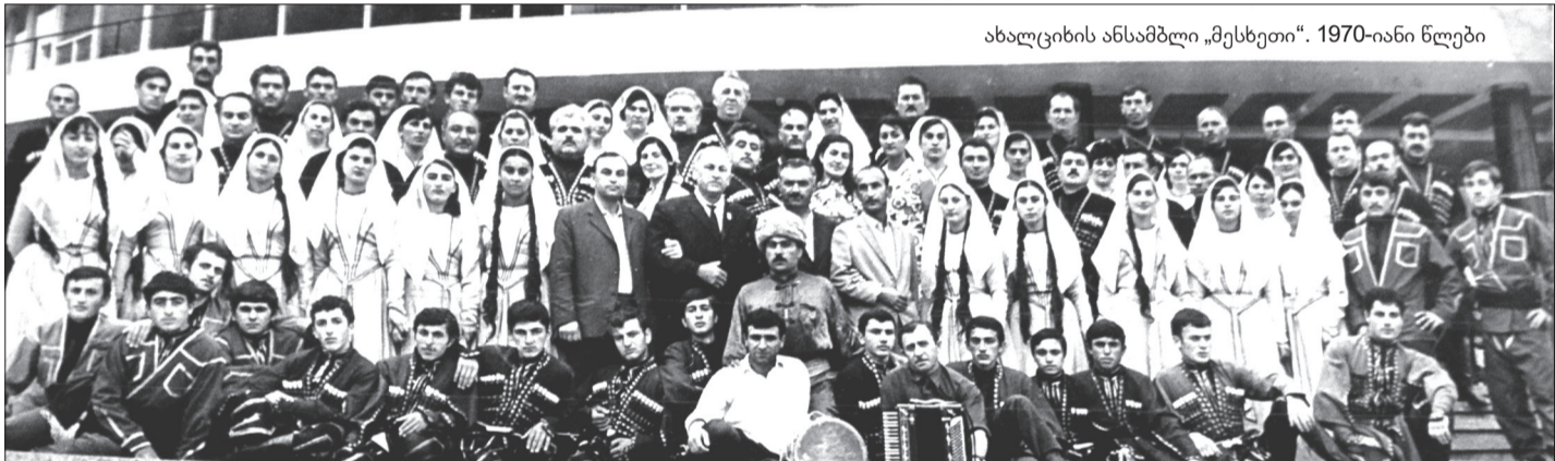
ახალციხის ანსამბლი „მესხეთი“. 1970-იანი წლები