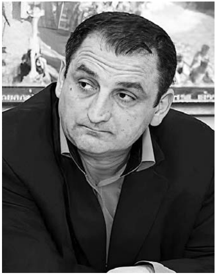
სასამართლომ უნდა თქვას გამამტყვევებელი სიტყვა.

— ბატონო გრიგოლ, BBC-მ გამოაქვეყნა ჟურნალისტური გამოძიების მასალები, რომელთა საფუძველზეც ყოფილი თავდაცვის მინისტრი დავით კეზერაშვილი საერთაშორისო