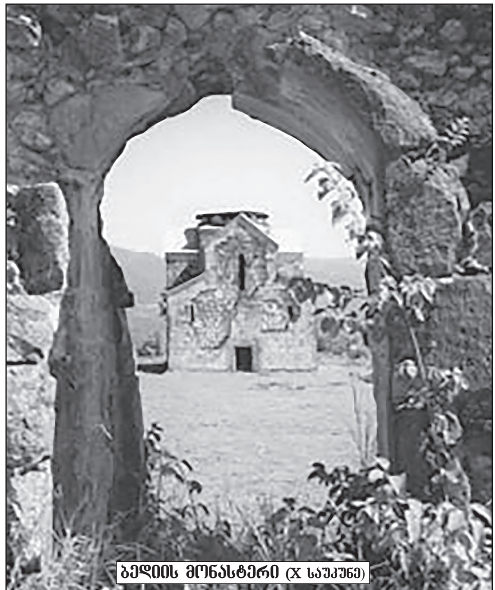
ბედიის მონასტერი (X საუკუნე)

რაციანზე საუბარი, ჩვენც უნდა გვქონდეს ჩვენი პირობები და ეს პირობები სწორედ ქართველი საზოგადოების ტრადიციულ ფასეულობებს, სახელმწიფო სუვერენიტეტს უნდა დავეკავშიროთ. შესაბამისად, საზოგადოებასთან ერთად უნდა დავიწყოთ მსჯელობა იმის დასაზუსტებლად, რა პირობების დაცვას ვითხოვთ ევროკავშირისგან საქართველოს ევროპული ინტეგრაციის გზაზე. ამ პირობებს თუ არ დავაყენებთ, ვერც სუვერენიტეტს დავიყავთ, ვერც ტრადიციულ ფასეულობებს და ვერც მშვიდობას ჩვენს ქვეყანაში!..