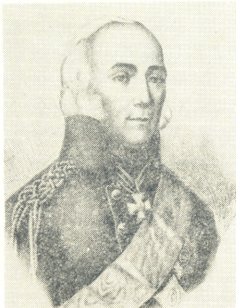
პავლე ციციშვილი (ციციანოვი)

პავლე დიმიტრის ძე ციციშვილი-ციციანოვი იმ ქართველ თავადთა შთამომავალია, რომელიც ერთ-ერთი პირველთაგანი გადასახლდა რუსეთში, თავი ისახელა მამაცობითა და გმირობით, განათლებით, ღრმა ცოდნითა და სამხედრო და პოლიტიკური მოღვაწეობით საუკეთესო ფურცლები ჩაწერა ამ ქვეყნის ისტორიაში.