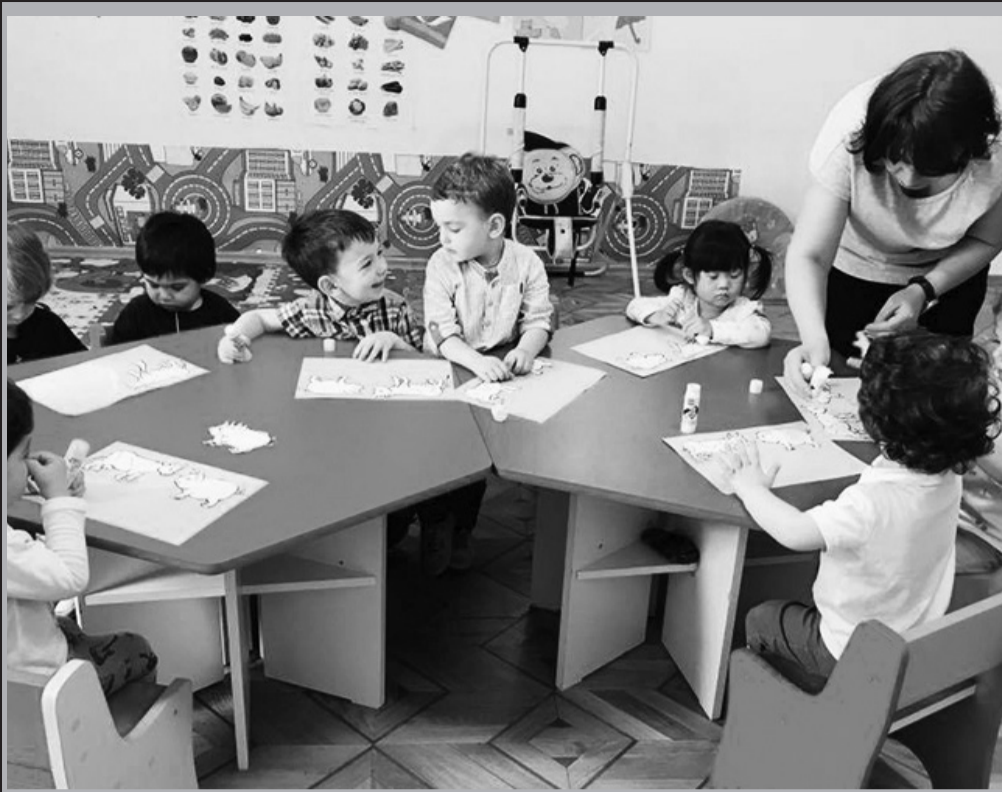
- საბავშვო ბავშვები -