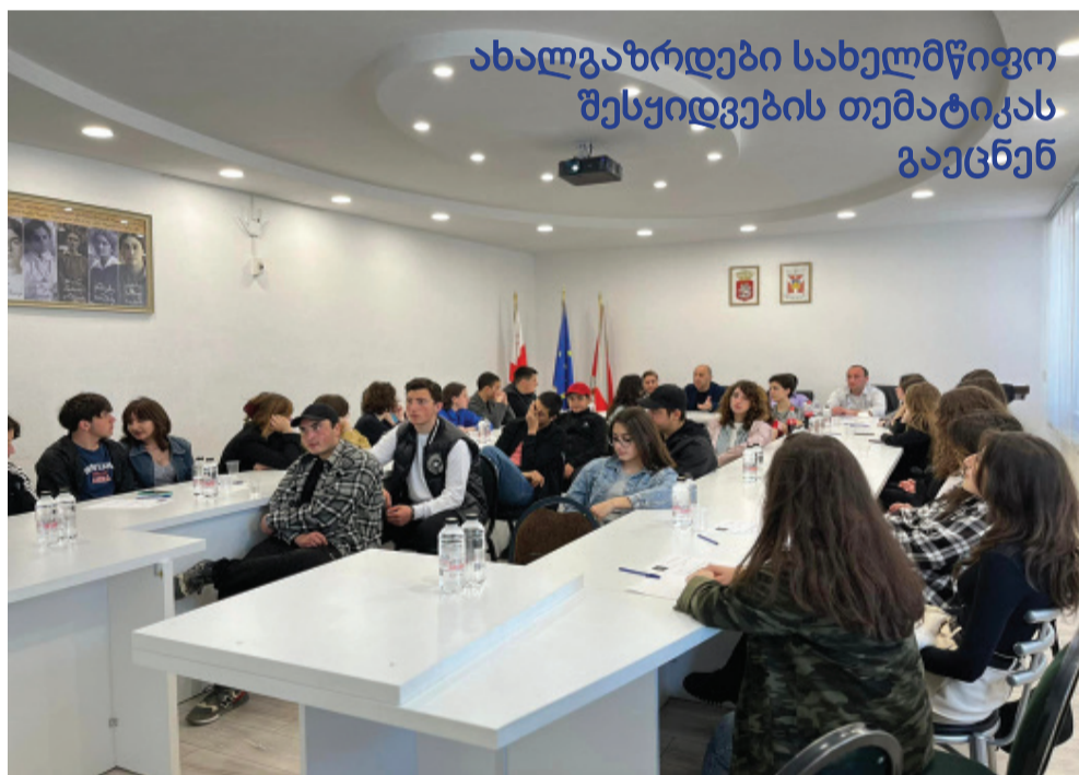
ახალგაზრდები სახელმწიფო შესყიდვების თემატიკას გაეცნენ

მონაწილეობითი ბიუჯეტირების მეთოდოლოგიის შემუშავება განხორციელდა საქართველოს მუნიციპალიტეტების კარგი პრაქტიკის გათვალისწინებით.