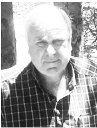
რინობა გაგემართათ, რაც ქვეყნისთვისაც არაა ურიგო საქმე... როგორ მოახერხებთ?