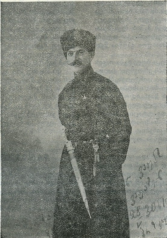
მ ა მ შ უ ც ა რ ი ლ ო ს მ ა შ ა ს ვ ი ზ ი

შ ი ნ ა ა რ ს ი : ქაქუცას ცხოვრება. ეროვნული დაკრძალვა. სიტყვები. მეთაური—სტალინისში. ვიკ. ნიქაძე—საქართველო. გვოზოლიტიკისათვის. —ლი—გ.—საქართველო ციფრებით. რ. სივილი—სტამბულის სავანის ავკარგი. საქართველოს ამბები. უკრაინელთა შორის. საბუთა რუსეთში და სხვ.