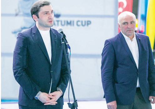
ფარიკავე გავიდა. ოლიმპიადის ქულები რვა მოფარიკავემ მოიპოვა.

მუხრან ვახტანგაძის სახელობის ბათუმის სპორტის სასახლეში სამ დღეს მიმდინარეობდა ქალთა შორის მსოფლიო თასის გათამაშება ხმლით ფარიკაობაში «ბათუმის თასი 2023», რომელშიც 36 ქვეყნის 26 გუნდი (ბრაზილიის, ესპანეთის, საფრანგეთის, ბულგარეთის, საბერძნეთის, უკრაინის, საქართველოს, შონკონგის, კორეის, იაპონიის, კანადის, თურქეთის, აზერბაიჯანის...) 200-მდე სპორტსმენი მონაწილეობდა, მათ შორის, ოლიმპიური, მსოფლიო და ევროპის ჩემპიონები. ქალაქმა ასეთი რანგის ტურნირის ფარიკაობაში პირველად უმასპინძლა