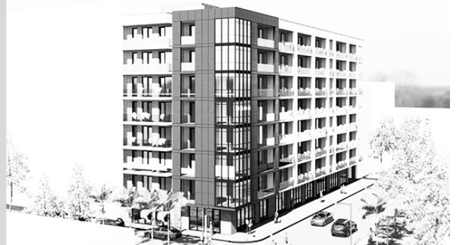
მშენებლობისთვის 8 მილიონ ლარზე მეტია გამოყოფილი. სამუშაოები 2024 წლის აგვისტოში დასრულდება.