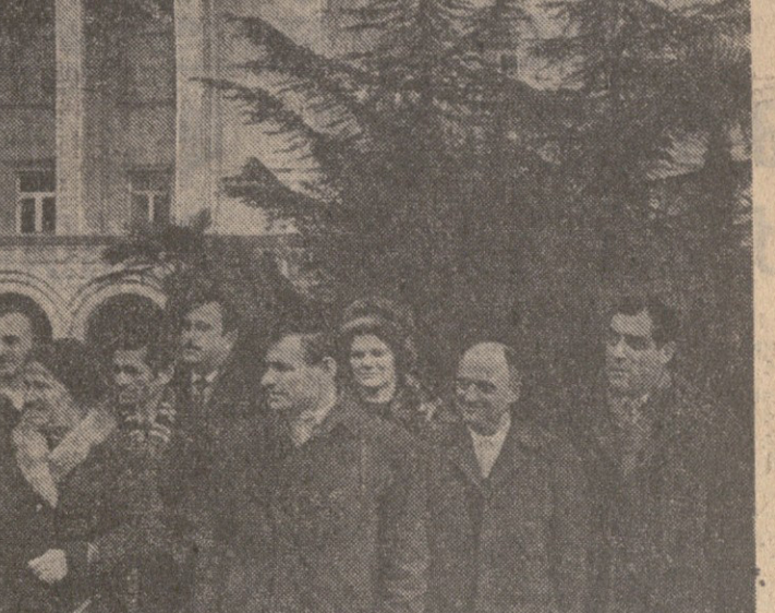
საქართველოს სსრ მინისტრთა კაბინეტის წევრები