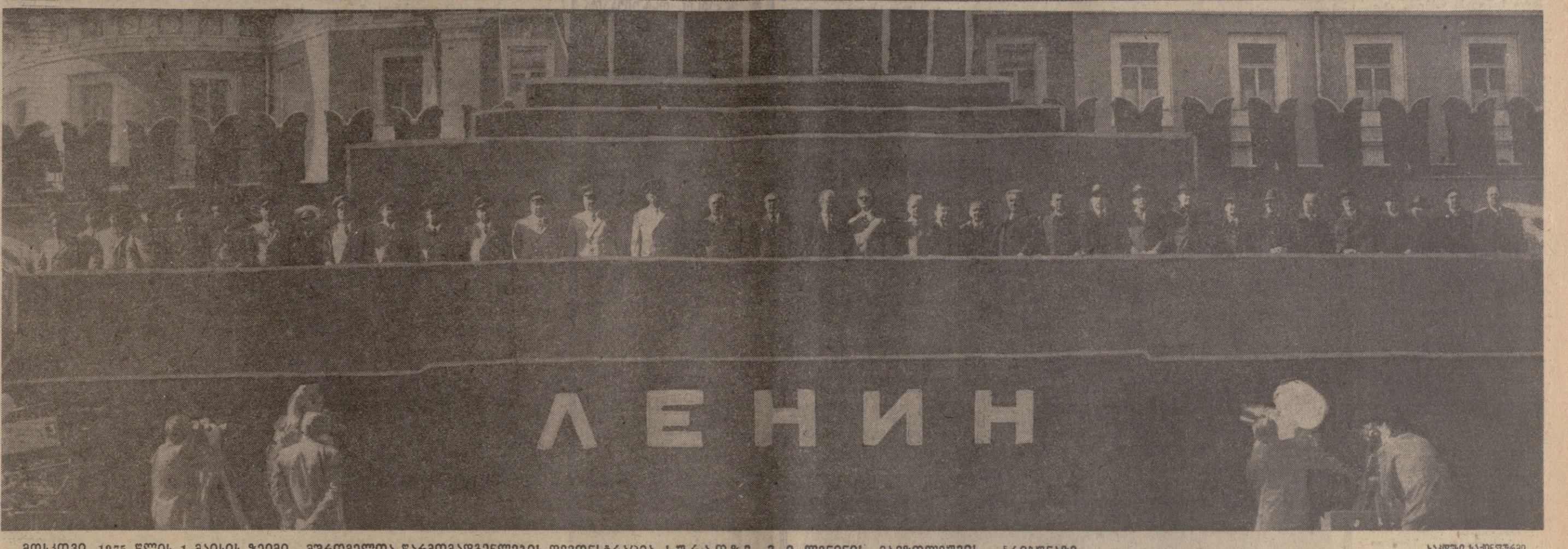
მოსკოვი, 1975 წლის 1 მაისის ღიაღამე. მშენებლისა და მშვიდობის დღის აღიარების დასრულება. მსოფლიო მოსახლეობის მიერ აღიარებული დღის აღიარების დასრულება. მსოფლიო მოსახლეობის მიერ აღიარებული დღის აღიარების დასრულება.