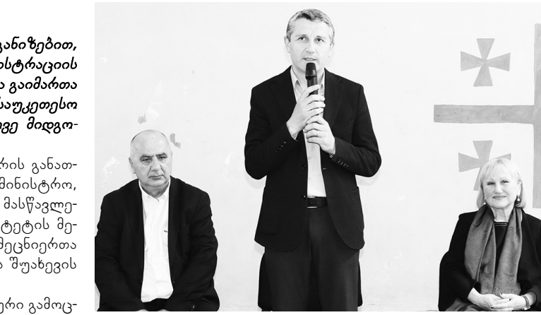
სის დამრიგებლების პროფესიული განვითარების იყო.

შუახევის რესურსცენტრის ორგანიზებით, მასწავლებელთა და სკოლის ადმინისტრაციის მებრუნე მუნიციპალური კონფერენცია გაიმართა სახელწოდებით „სკოლის მართვის საუკეთესო პრაქტიკა და სწავლების თანამედროვე მიდგომები“.