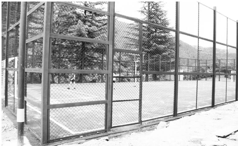
რთი, ასევე კალათბურთი და ფრენ-ბურთი.

სპორტული ინფრასტრუქტურის მოწესრიგება ქედის მუნიციპალიტეტის ხელმძღვანელობის მთავარი პრიორიტეტია. სტადიონების აგებაში, სპორტული დარბაზების მოწყობაში საფუძველი დაუდო იმ წარმატებებს, რაც ქედელმა სპორტსმენებმა ბოლო დროს მოიპოვეს. ეს პროცესი გრძელდება.