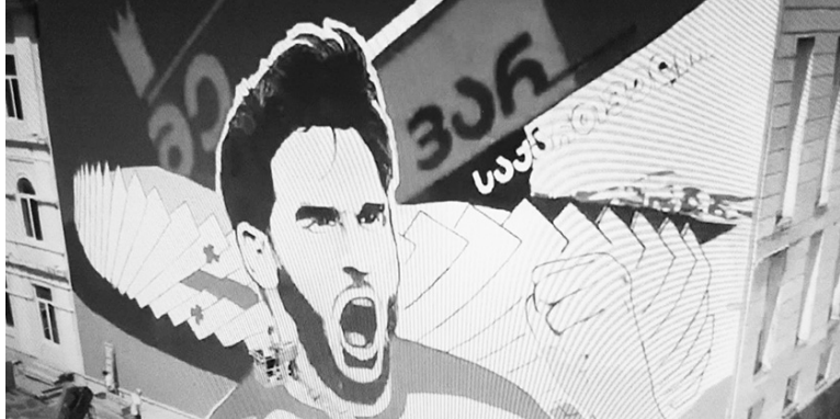
სალი წესის წახალისებასა და პოპულარიზაციას უწყობს ხელს.

ბათუმში ევანგელური ქუჩის მხატვრობა გამოჩნდა - შოთა რუსთაველის სახელობის ქართველთა ცენტრის კედელზე ცნობილი ქართველი ფეხბურთელი ზვიად აკარაძის ბათუმის სტადიონის ფონზე გამოსახული.