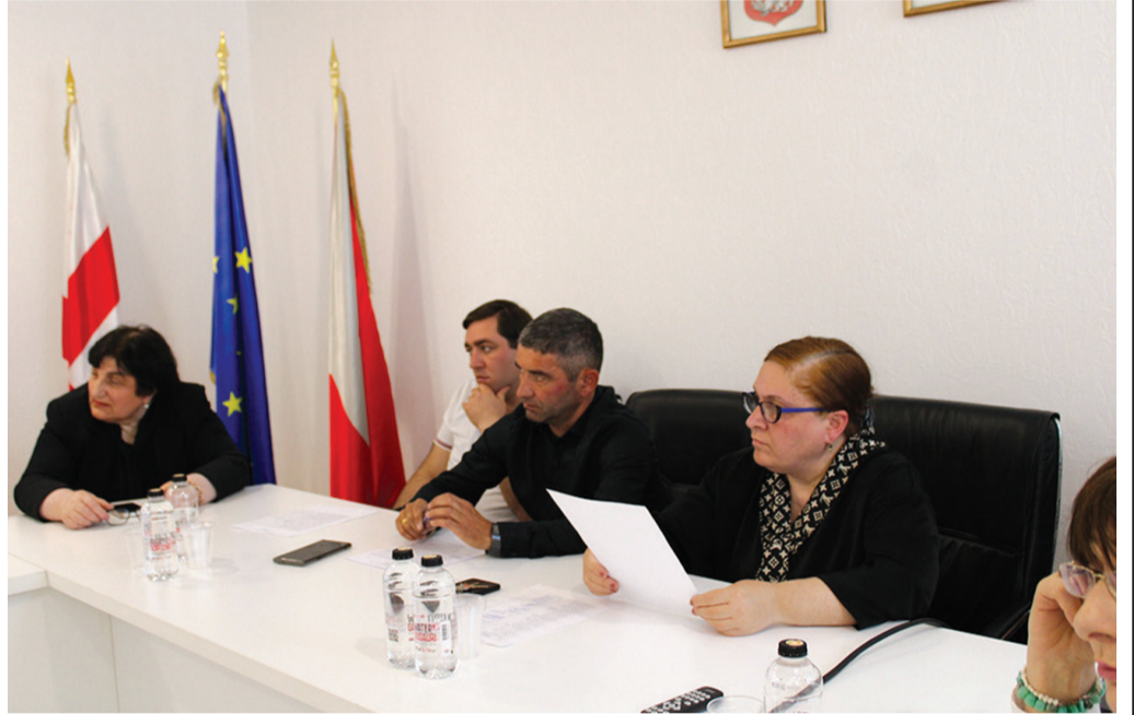
სამსახურის შესყიდვებისა და მატერიალურ-ტექნიკური უზრუნველყოფის განყოფილების მიერ 2022 წელს გაწეული მუშაობა. საკითხები მერიისა და საკრებულოს სტრუქტურული ერთეულების ხელმძღვანელებმა და სპეციალისტებმა წარმოადგინეს.

სხდომამ მოისმინა და დადებითად შეაფასა მერიის ადმინისტრაციული