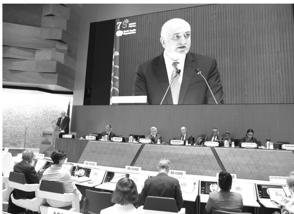
"За 10 лет существования программы нам удалось расширить услуги и удовлет-

Как отметил Зураб Азарашвили, согласно действующему плану к 2025 году гепатит С, лечение которого в Грузии финансируется государством, должен быть полностью ликвидирован.