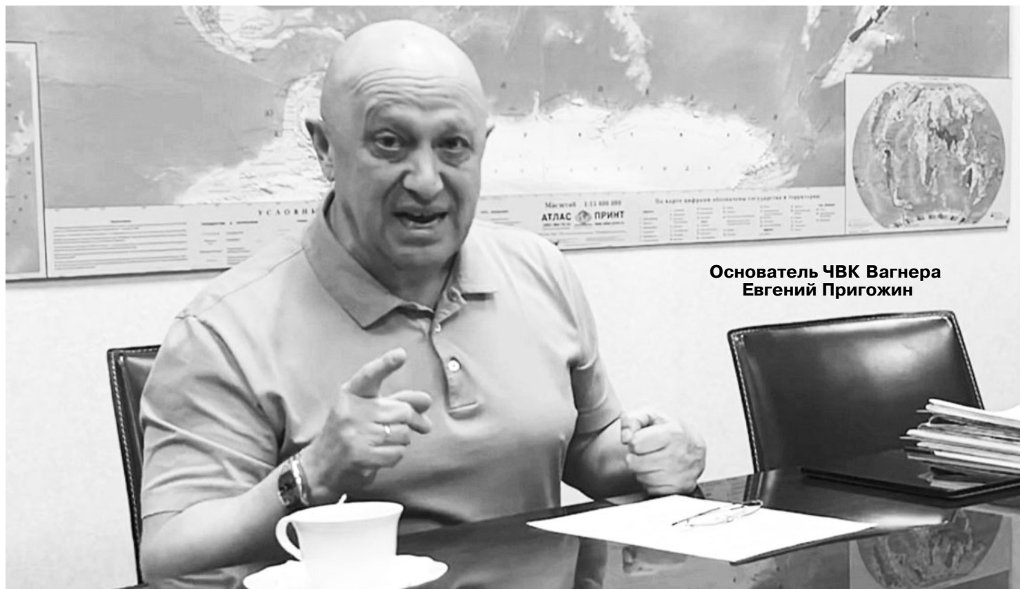
Основатель ЧВК Вагнера Евгений Пригожин

Пессимистичный сценарий: украинцам дают ракеты, они готовят войска, безусловно они будут продолжать наступление, пытаться контратаковать.