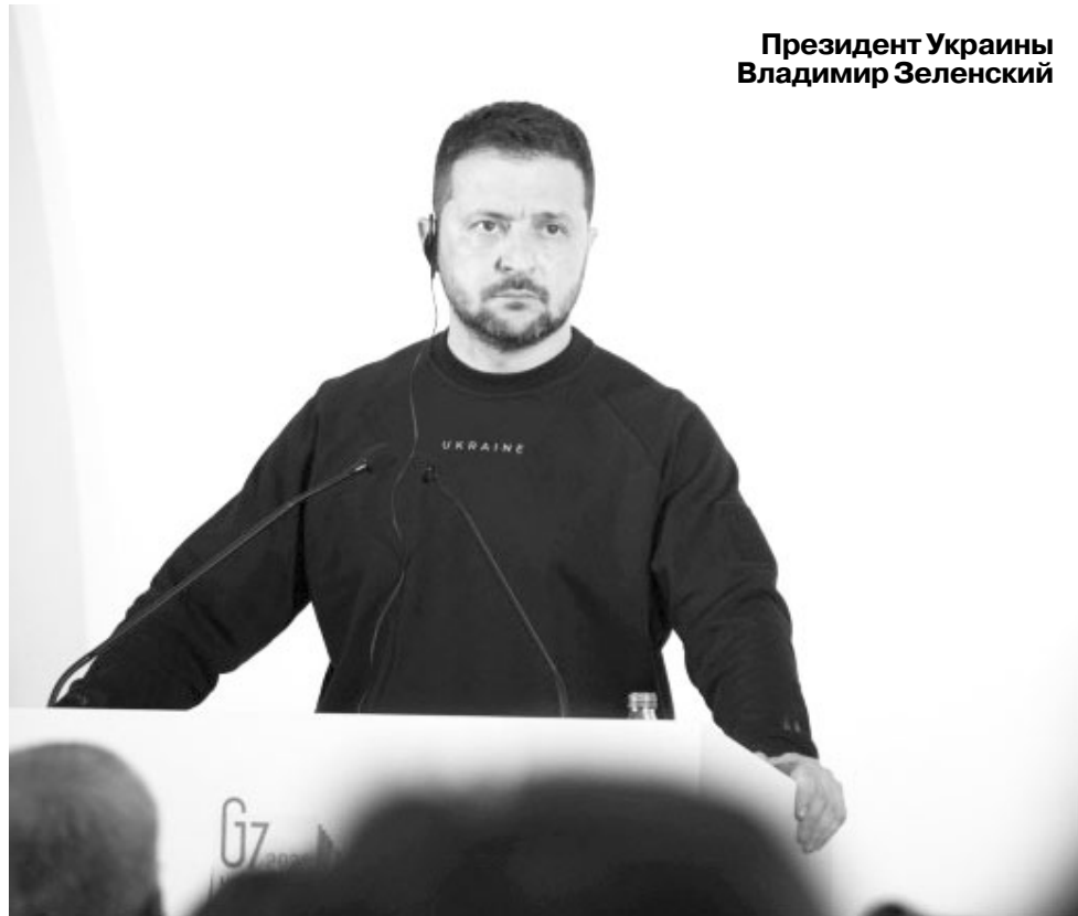
Президент Украины Владимир Зеленский

бы с демократией, международным правом, свободой считались».