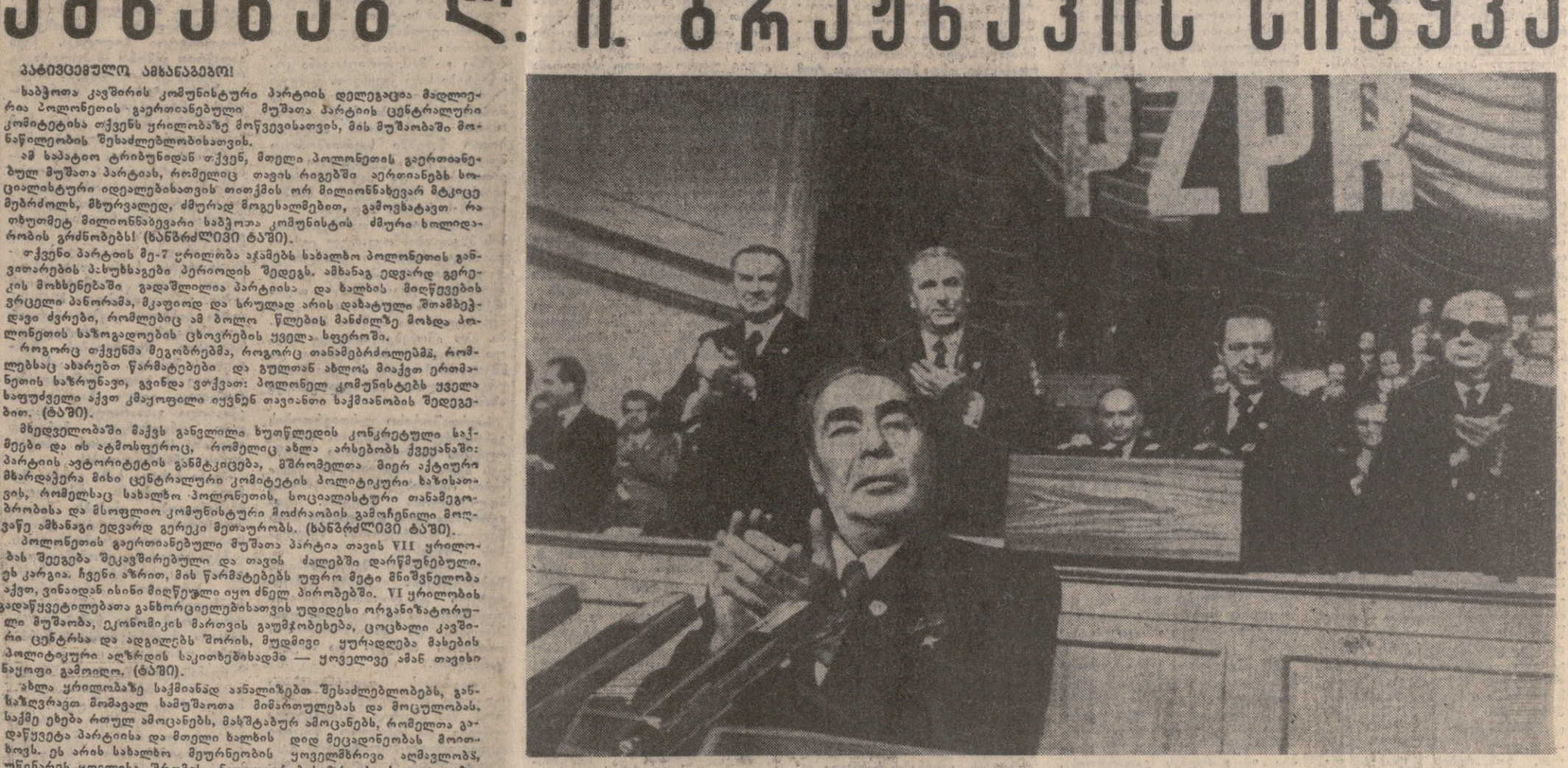
ბერია ლ. ნ. ბრეჟნევი

საბჭოთა კავშირის კომუნისტური პარტიის ცენტრალური კომიტეტი საბჭოთა კავშირის კომუნისტური პარტიის ცენტრალური კომიტეტი საბჭოთა კავშირის კომუნისტური პარტიის ცენტრალური კომიტეტი