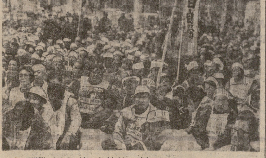
შეიშა იაონიზი გრძელდება მასობრივი გამოსვლები... შეიშა იაონიზი გრძელდება მასობრივი გამოსვლები...