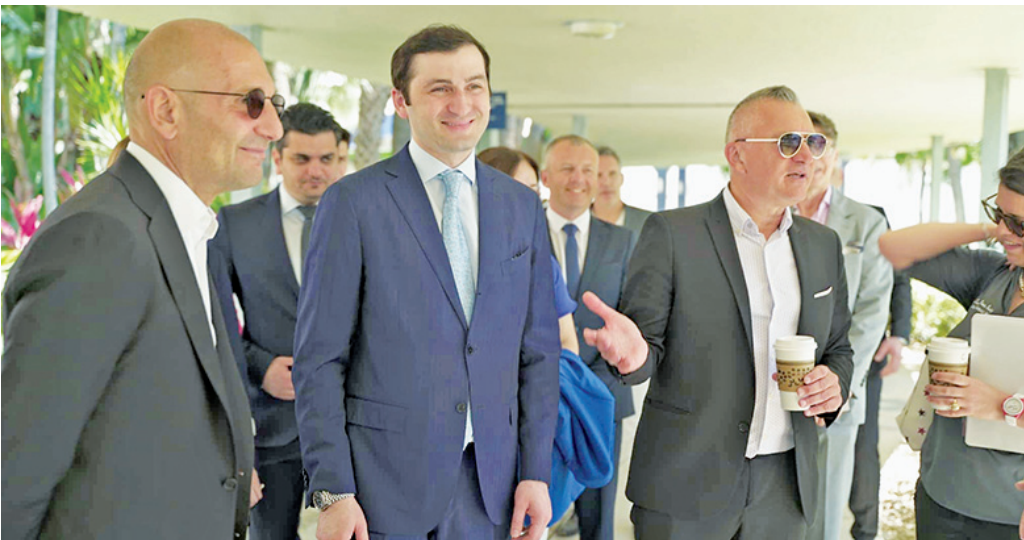
კური განვითარების ერთ-ერთი წარმატებული მაგალითია. აქედან გამომდინარე, ძალიან მნიშვნელოვანია მათი გამოცდილების, თანამედროვე

საქართველოს პარლამენტის თავმჯდომარე შალვა პაპუაშვილმა, საფრანგეთში ვიზიტის ფარგლებში, შეხვედრა გამართა საფრანგეთის ეროვნული ასამბლეის თავმჯდომარე იაელ ბრაუნ-პიგესთან. საუბარი შეეხო ქვეყნებს შორის ორმხრივი ურთიერთობების გაღრმავებას, მათ შორის, სპარტაშვილი კავშირების, კულტურის, განათლების და ვაჭრობის მიმართულებებით. ხაზი გაესვა საქართველოს ევროინტეგრაციის პროცესში საფრანგეთის მხარდაჭერის მნიშვნელობას. შალვა პაპუაშვილმა ისაუბრა საქართველოს პარლამენტის როლზე 12 რეკომენდაციის შესრულების პროცესში და მიმოიხილა, ამ მხრივ, საქართველოს პროგრესი.