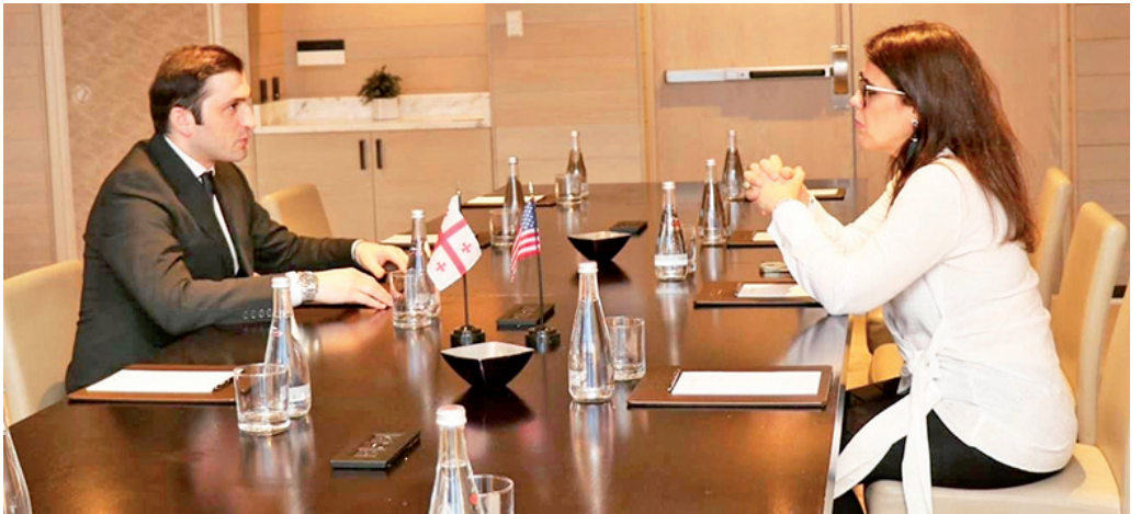
ტენდენციების გაზიარება და დამკვიდრება ჩვენს ქვეყანაში», - განაცხადა თორნიკე რიჟვაძემ.

ნაილი ხაბთაძე 27 48 93 ამერიკის შეერთებულ შტატებში, ოფისიანლური ვიზიტის ფარგლებში, აჭარის ავტონომიური რესპუბლიკის მთავრობის თავმჯდომარე თორნიკე რიჟვაძე ფლორიდას შტატის სენატორ ანა მარია როდრიგესს შეხვდა. შეხვედრაზე ქვეყნებს შორის არსებულ სტრატეგიულ ურთიერთთანამშრომლობას გაესვა ხაზი, ასევე, საუბარი შეეხო ეკონომიკური ურთიერთობის გაღრმავებას. «ამერიკის შეერთებულ შტატებში ოფისიანლური ვიზიტის ფარგლებში, ფლორიდას შტატის სენატორ ანა მარია როდრიგესთან შეხვედრაზე, ქვეყნებს შორის არსებულ სტრატეგიულ თანამშრომლობაზე და ეკონომიკური ურთიერთობის გაღრმავების პერსპექტივების შესახებ ვიმსჯელებ. ვიზიტის ფარგლებში დაგეგმილი გვაქვს მნიშვნელოვანი შეხვედრები საჯარო და ბიზნესსექტორის წარმომადგენლებთან. ფლორიდა, მაიამი ტურიზმის და ეკონომი-