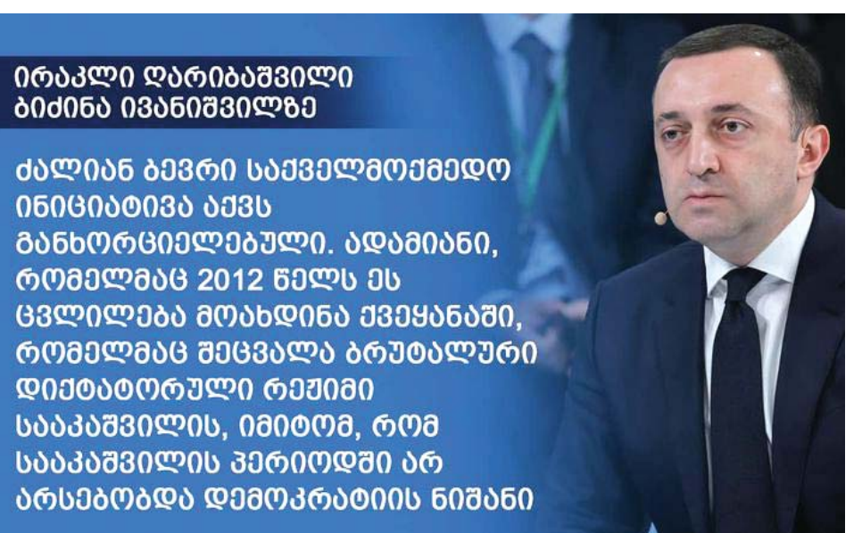
ირაკლი ღარიბაშვილი ბიძინა ივანიშვილზე

❖ საქართველო თუ ვერ მიიღებს კანდიდატის სტატუსს წლის ბოლოსთვის, ეს იქნება ძალიან დიდი შეცდომა.