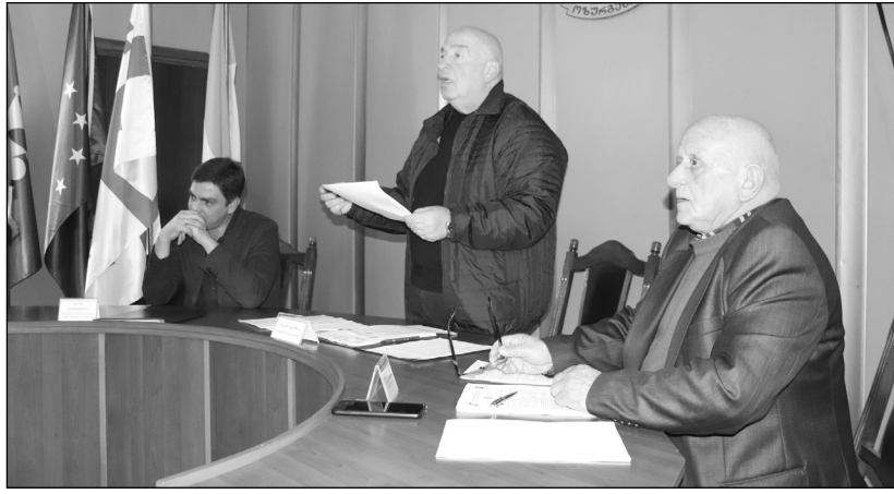
პალიტეტის 2022 წლის ბიუჯეტის III საკრებულომ ცნობად მიიღო კვარტლის შესრულების ანგარიშის ინფორმაცია, „ოზურგეთის მუნიციპალიტეტის 2022 წლის ბიუჯეტის III კვარტლის შესრულების ანგარიშის მიმოხილვის თაობაზე“

დამტკიცდა შემდეგი დადგენილება: ოზურგეთის მუნიციპალიტეტის კონრების პრივატიზების და სარგებლობის უფლებით გადაცემის დამატებითი წესისა და ნასყიდობის ხელშეკრულების ფორმების დამტკიცების შესახებ;